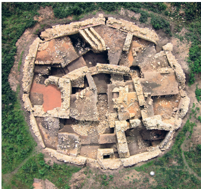
Abb. 1 Das Oktogon der Holsterburg im Luftbild. Aufgenommen am 30. September 2014 (Foto: LWL-Archäologie für Westfalen/D. Welp und Pahls Luftbilder, Paderborn).

Dass die von Holthusen/Berkule originär Mainzer Gefolgsmannen waren, geht aus dem ältesten Lehnsverzeichnis eines Zweiges der Familie hervor: der von Calenberg. Das in zwei Abschriften erhaltene Verzeichnis lässt sich in die 1230er-Jahre zurückdatieren und erweist sich als höchst ergiebige Quelle in Be-