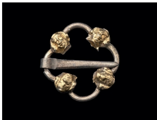
Abb. 5 Silberschnalle mit aufgesetzten Männerköpfen, Silber und Gold. Durchmesser 1,3 cm.