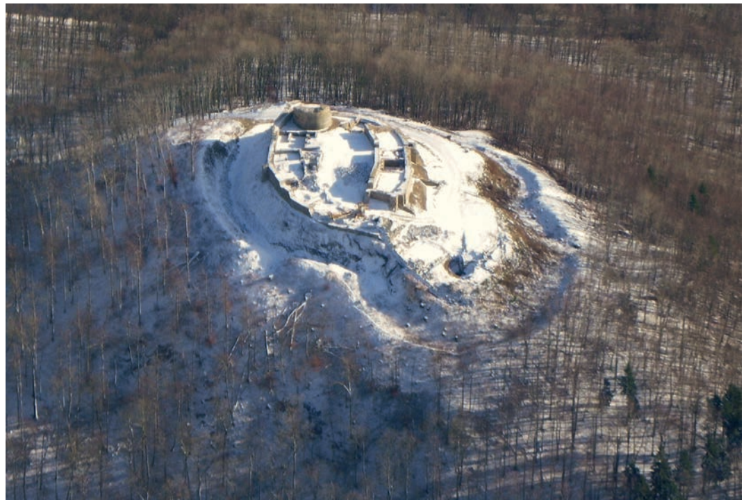
Abb. 1 Luftbild der Falkenburg nach Abschluss der Grabungs- und Sanierungsarbeiten 2005 bis 2013.

Die Grabungen betrafen auch eine seit 2006 bekannte kleinräumige Baustruktur in der nördlichen Randhausbebauung. Die eingehende Untersuchung bestätigte die Vermutung, dass es sich hierbei um einen Einbau aus der Mitte des 15. Jahrhunderts handelt. Aufgrund von Form und Lage wird es sich bei der kleinen Kammer mit Podest an der Ringmauer um den Stand einer Kammerbüchse oder eines sehr kurzen Vorderladers gehandelt haben. Einer Kammerbüchse ist hierbei der Vorzug zu geben, da derartige Hinterla-