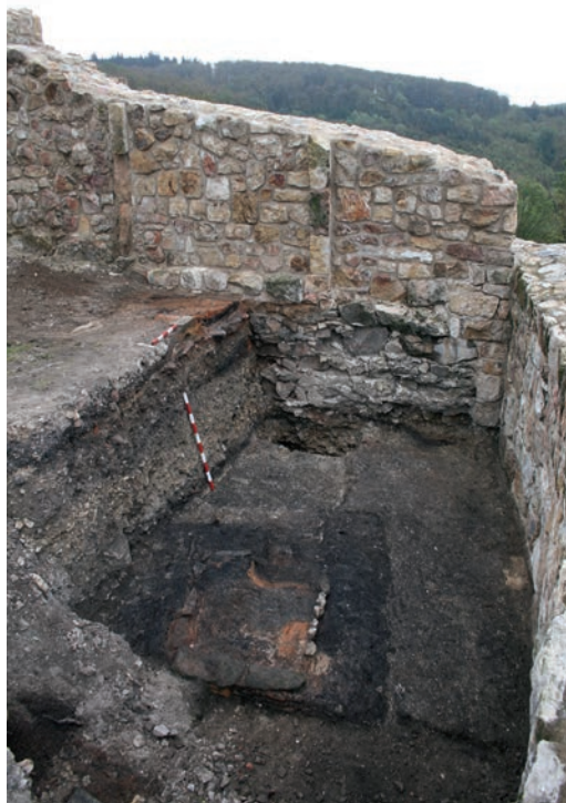
Abb. 3 Hoch- und spätmittelalterliche Stratigraphie im östlichen Teil des spätmittelalterlichen Palas (Foto: LWL-Archäologie für Westfalen/T. Pogarell).

auf einem Thron sitzend, mit Lilienkrone und Lilienzepter in der rechten Hand dargestellt. Das Jesuskind mit Heiligenschein und zum Segen erhobener rechter Hand wird im linken Arm gehalten. Als Zeichen der umfassenden Herrschaft trägt das Jesuskind in seiner linken Hand eine Weltkugel, wobei aufgrund des Erhaltungszustandes nicht ganz sicher ist, ob ihr ein Kreuz aufgesetzt war. Der obere Abschluss des Pilgerzeichens zeigt an den abgerundeten Ecken sowie auf dem abgerundeten Mittelbogen turmartige Gebäude, deren Giebel jeweils ein Kreuz ziert. Den Mittelteil da-