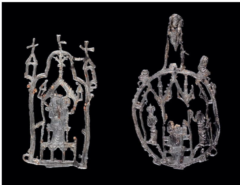
Abb. 4 Zwei Gittergusspilgerzeichen, Blei-Zinn-Legierung; links: Maria mit Kind. Höhe 8,6 cm, Breite 4,7 cm; rechts: Maria mit Kind, flankiert von der Hl. Katharina und Karl dem Großen. Höhe gesamt 9,9 cm, Mittelfeld 6,3 cm, Breite 5,4 cm.

runter unterteilen zwei Vertikalstäbe, die nach oben in eine Art Baldachin münden. Dieser trägt auf seiner Spitze einen Abschluss in Lilienform, während er rechts und links von turmartigen Gebäuden begrenzt wird. Das vermutlich aus dem Mittelrhein- oder Maasraum stammende Stück datiert ins 14./15. Jahrhundert. Ein Vergleichsfund aus Kampen datiert in die zweite Hälfte des 15. Jahrhunderts