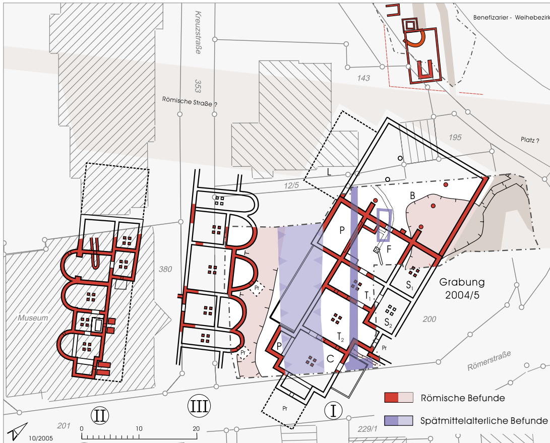
2 Übersichtsplan der Grabung im Zentrum des römischen Osterburken: Kastellthermen (I), zweites (Militär-?)Bad (II), Apsidenbau (III).

tiert, sodass die Ziegel theoretisch auch von Bauaktivitäten herrühren könnten, die lange nach dem Abzug der meisten Truppen stattgefunden haben.