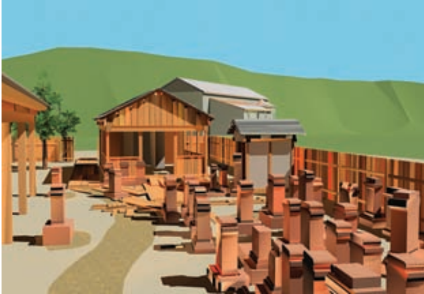
3 Der Osterburkener Benefiziarier-Bezirk zu Beginn des 3. Jhs. Zeichnerischer Rekonstruktionsversuch von S. Huther u. E. Schallmayer.

zelhöfen war auf eine funktionierende Sicherung im Vorfeld angewiesen, da sich die einzelnen Anwesen nicht schützen ließen. Die vielen großen, in Stein ausgebauten Wohngebäude der Bauernhöfe zeigen, dass hinter den Landbesitzern nicht eben die ärmste Bevölkerungsschicht stand. Von daher dürfte es kein Zufall sein, dass die Römer mit dem Bau durchgehender Sperranlagen erst begonnen haben, als im Hinterland der Provinz die landwirtschaftliche Nutzung des Landes einsetzte (ab 100 n. Chr.). So betrachtet wäre der Limes mit seinem Vorfeld nur die römische Form des Ödlandes, das laut Caesar die einzelnen germanischen Stämme um ihre Territorien einhielten, um vor gegenseitigen Überfällen sicher zu sein.