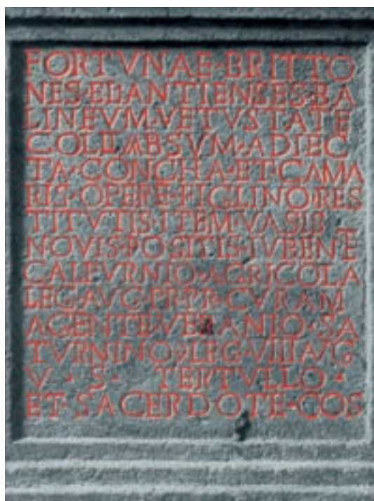
1 Einweihungsinschrift für den Neubau des zweiten Militärbades in Neckarburken. Der Text enthält ungewöhnlich viele archäologisch interessante Informationen.

Hersteller dieser Ziegel war die legio VIII Augusta aus Straßburg. Auch das kleine Kastell für den Numerus wurde von Baukommandos der 8. Legion errichtet. Das belegen beschriftete Bauquader. Eben solche Steine aus dem älteren Kohortenkastell stammen im Gegensatz dazu von der legio XXII Primigenia aus Mainz. Ursprünglich wurde daher die These vertreten, dass der Anbau des Zusatzkastells und die Stempellieferung durch die 8. Legion gleichzeitig seien und auch das kleine Bad unter Kaiser Commodus 185/192 n. Chr. errichtet worden sei. Von anderer Seite wurde dagegen vorgebracht, dass die Stempeltypen der 8. Legion aus dem kleinen Bad von verschiedenen Plätzen des vorderen wie des hinteren Limes bekannt seien, was dafür spräche, dass man diese Stempel gerade in der Zeit des Umzugs, d.h. in der Mitte des 2. Jhs. verwendet hätte. Dann müsste entweder der Numerus schon früher in Osterburken angekommen sein als bislang aufgrund der Bauinschrift des Steinkastells angenommen – mit Folgen für die Bedeutung der Neckarburkener Renovierungsinschrift von 158 n. Chr. – oder das kleine Bad gehört nicht zu ihm. Leider sind die zur Datierung der Ziegelstempel der 8. Legion herangezogenen Bauten am hinteren Limes selbst nur unzureichend da-