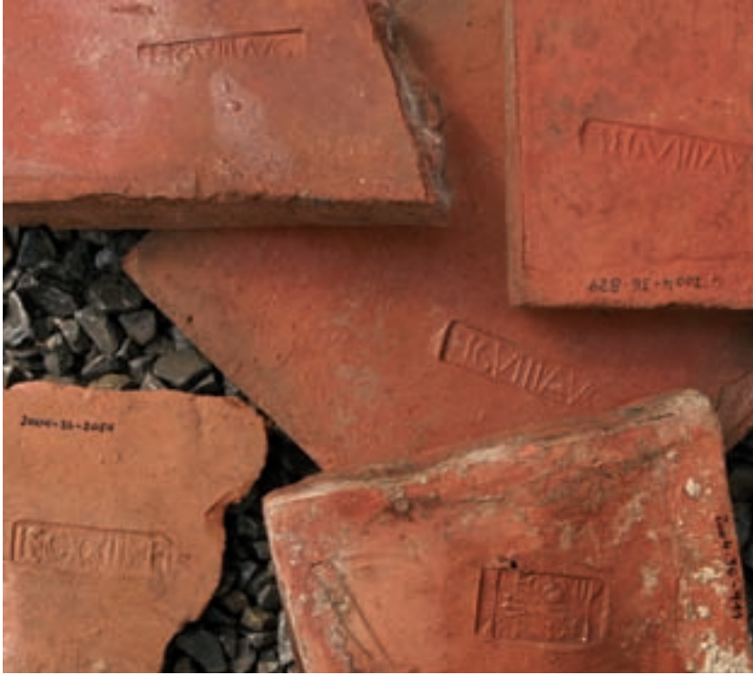
5 Die im Bad gefundenen gestempelten Ziegel beweisen, dass beide obergermanische Legionen gleichzeitig Baumaterial nach Osterburken geliefert haben.