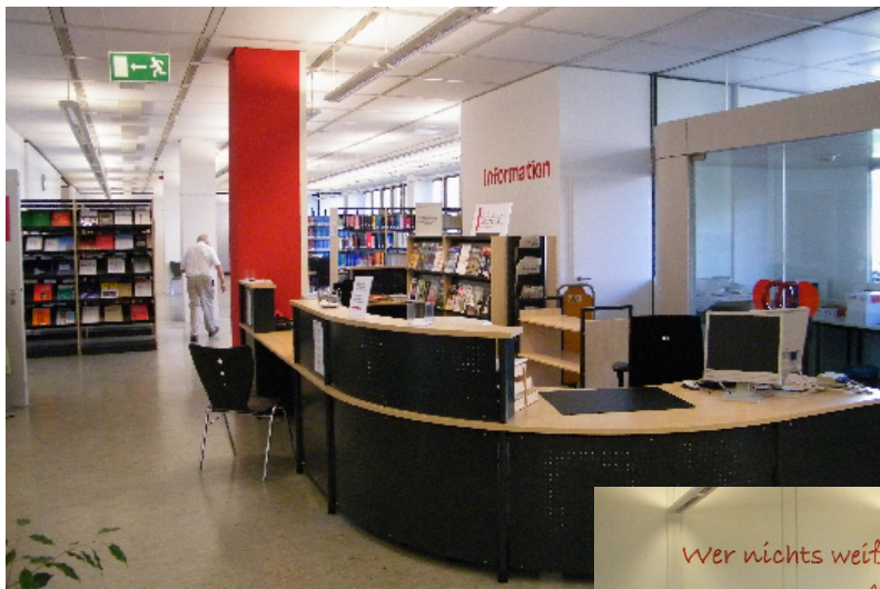
Theke mit Blick auf die Zeitschriftenauslage

Wie schon beim Umbau der Ausleihe haben wir auch diesmal viele positive Reaktionen unserer NutzerInnen erhalten und sind überzeugt, dass sich auch diese Investition gelohnt hat.