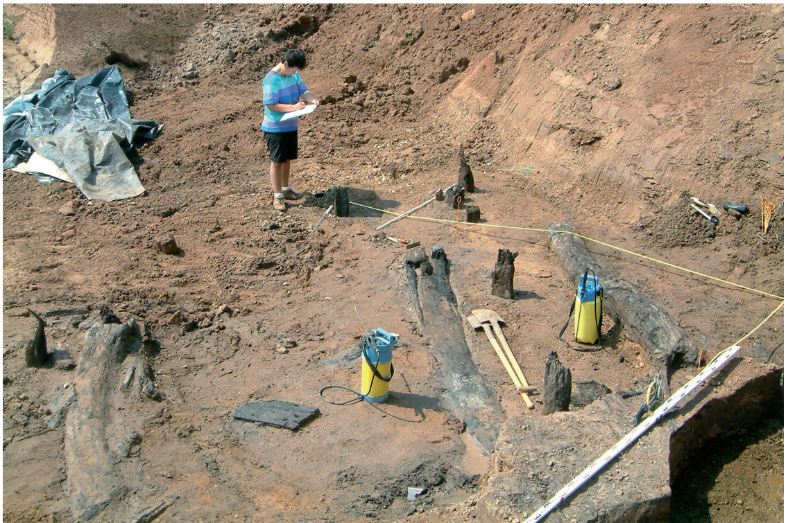
93 Erftstadt-Niederberg, Rotbachtal. Hölzer der karolingischen Mühle während der Freilegung.

Im Frühsommer informierte ein interessierter Anwohner das Rheinische Amt für Bodendenkmalpflege über Holzfunde, die bei der Anlage dieses neuen Bachbettes zutage gefördert worden waren. Einige aufgefundene Mühlsteinbruchstücke sowie römische und mittelalterliche Keramik deuteten auf ein hohes Alter der Hölzer inmitten der Bachaue. Nachdem ein Team der Außenstelle Nideggen eine größere Fläche rund um die angeschnittenen Hölzer freigelegt hatte, zeigte sich ein eindrucksvoller archäologischer Befund: zum einen Mauerstickungen und Gruben eines bereits bekannten benachbarten römischen Landguts ( villa rustica ); zum anderen ließen mehrere mächtige Eichenbohlen, die an beiden Enden mit Pfosten im Boden verzapft waren, ein etwa 20 m 2 großes hölzernes Bauwerk am Rande einer Wasser führenden Rinne des Rotbaches erschließen (Abb. 93). Die oberen Enden