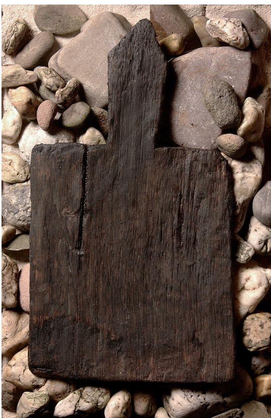
94 Erftstadt-Niederberg, Rotbachtal. Brettchen des Schaufelrades.

Die genaue zeitliche Einordnung der Eichenhölzer erfolgte durch dendrochronologische Untersuchungen an der Universität zu Köln. Die Hölzer für den Bau der Anlage wurden 832 geschlagen, sodass der Bau der Mühle sicherlich im Jahr 833 erfolgte. Damit handelt es sich um die älteste nachgewiesene Wassermühle im Rheinland. Sie hatte am Rotbach eine noch unbekannte Zeitspanne gearbeitet, bevor sie wohl durch die Wassermengen eines Hochwassers so stark beschädigt war, dass eine Reparatur oder ein