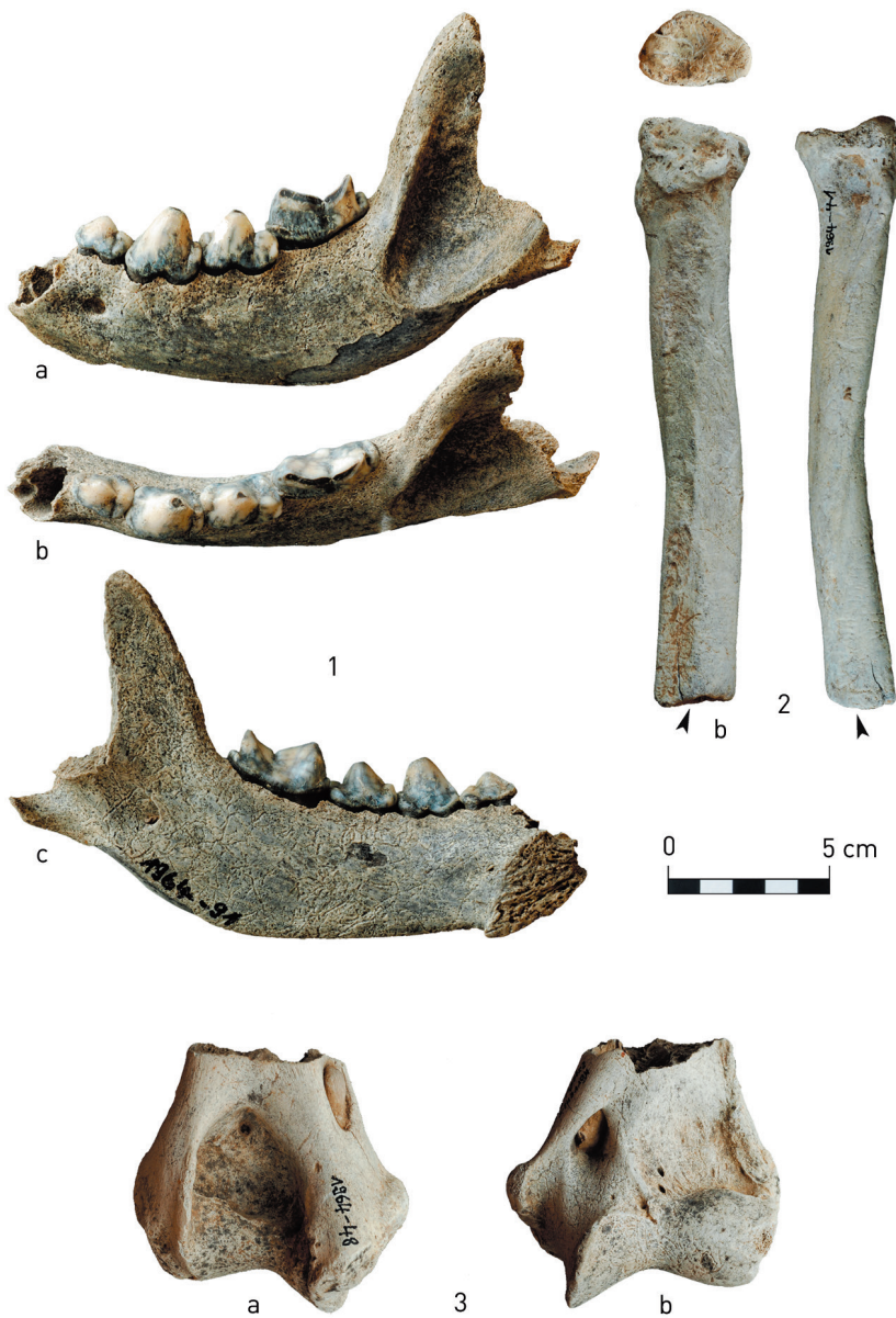
2 Linnich-Körrenzig, Ziegeleigrube Coenen. Großsäugerreste, 1–2 Höhlenhyäne: 1 Mandibula mit p2-m1 sin., a Lateral, b Okklusal, c Medial; 2 Radius sin., a Proximal, b Medial, c Lateral; die Pfeile zeigen auf das fehlende Gelenkende und die typische Abrundung des Knochenschafts durch Tierverschleiß; 3 Höhlenlöwe: distales Gelenkende eines Humerus sin., a Caudal, b Cranial.

durch eine weitere Fundstelle aus einer Löss-Sequenz wesentlich ergänzt. Schon in den 1960er Jahren wurden in der Abbauwand der Ziegeleigrube Coenen (Gemarkungen Körrenzig und Glimbach, Stadt Linnich) am östlichen Hang des Rurtals zahlreiche Reste pleistozäner Megafauna geborgen (Abb. 1). Mehrere Funde sind damals an das Römisch-Germanische Museum nach Jülich gelangt (heute Museum Zitadelle Jülich) und werden seit 2009 im Rahmen eines interdisziplinären Projektes aufgearbeitet. Dabei ließen sich weitere Tierknochen in der Sammlung des Geologen Jörg Schalich ermitteln, sodass insgesamt 106 Faunenreste dokumentiert sind. Die vorliegenden Funde aus der Ziegeleigrube Coenen spiegeln wahrscheinlich nur einen kleinen Teil des eigentlichen Bestandes wider, da die Fundschicht lediglich sporadisch abgesammelt wurde und eine systematische Untersuchung