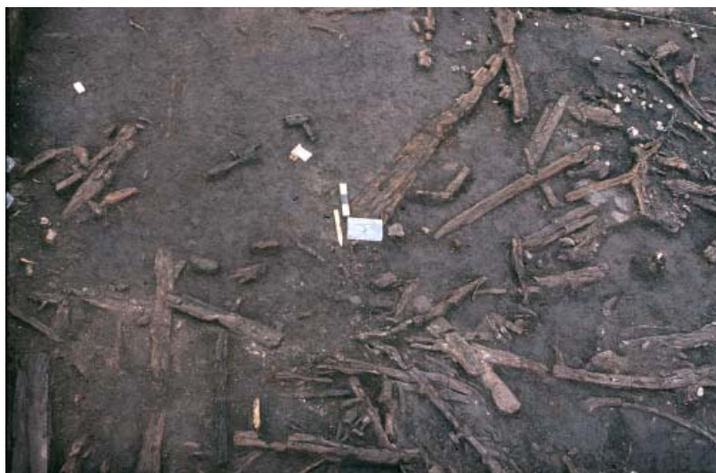
Abb. 2 Holzfunde während der Ausgrabungen 1985 (Foto: LWL-Archäologie für Westfalen/W. Best).

Vor diesem Hintergrund wurden im Rahmen einer Magisterarbeit die Auswertung und Neuinterpretation durch einen Vergleich mit Fundplätzen in Mittel- und Nordeuropa vorgenommen. Die Holzfunde wurden analysiert und mit denen anderer Fundstellen verglichen. So konnten sie als Einhegungen, Plattformkonstruktionen und Untergrundbefestigungen identifiziert werden. Die wenigen datierbaren Gefäßfragmente weisen in die frühe vorrömische Eisenzeit, eine Kontinuität bis in die späte vorrömische Eisenzeit/frühe römische Kaiserzeit ist nicht auszuschlie-