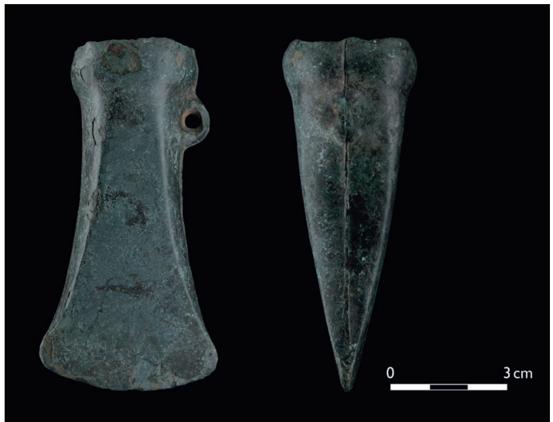
Abb. 1 Glänzend dunkelgrün patiniert ist die Oberfläche des gut erhaltenen Beils von Marsberg-Giershagen, M I:1.

Das Beil ist 9,2 cm lang, die Schneide 4,7 cm breit. Die Tülle mit quadratischer Mundöffnung hat außen einen Durchmesser von 3,3 cm. Der Tüllenmund ist wulstig, rund-