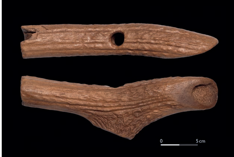
Abb. 3 Aus der Sandgrube Schencking bei Greven stammt eine sehr gut erhaltene T-Axt, die aufgrund ihrer Lage im Münsterland und ihrem Alter um 4900 v. Chr. in einen endmesolithischen Zusammenhang gehört.

In diese kulturhistorisch spannende Zeit gehören die T-förmigen Geweihäxte aus Rothirschgeweih, die nicht nur von endmesolithischen, sondern auch von neolithischen Gemeinschaften genutzt wurden. Dabei handelt es sich um Werkzeuge mit schräg angeschnittener Schneide, die aus dem Mittelstück einer Geweihstange mit einer an der Basis abgetrennten Sprosse gefertigt wurden. Die Durchlochung für den Schaft erfolgte im Sprossenansatz, wobei die restliche Sprossenbasis eine kleine Tülle bilden kann.