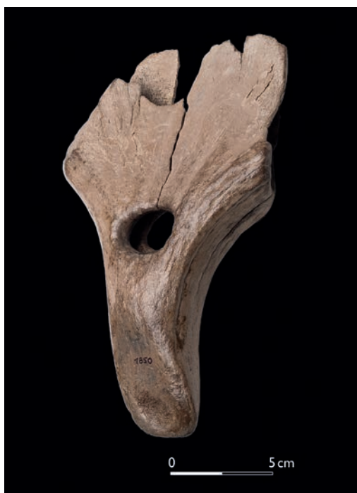
Abb. 2 Diese typische Elchgeweihhacke, ein Baggerfund aus Paderborn-Sande, gehört mit ihrem Alter von 9000 v. Chr. zur frühen Maglemose-Kultur (Foto: LWL-Archäologie für Westfalen/S. Brentführer, A. Müller).

Neben Fundplätzen mit Steinartefaktinventaren gelang es, auch interessante mesolithische Altfunde aus Geweih erstmals näher zu datieren. Mit dem Beginn der von England bis ins Baltikum verbreiteten Maglemose-Kultur erscheinen an der Wende zum Holozän um 9600 v. Chr. verschiedene neue Knochen- und Geweihgeräte. Dazu gehören u. a. breite Hacken aus den Schaufeln von Elchgeweihen. Ein solches Gerät wurde vor über 20 Jahren aus einer