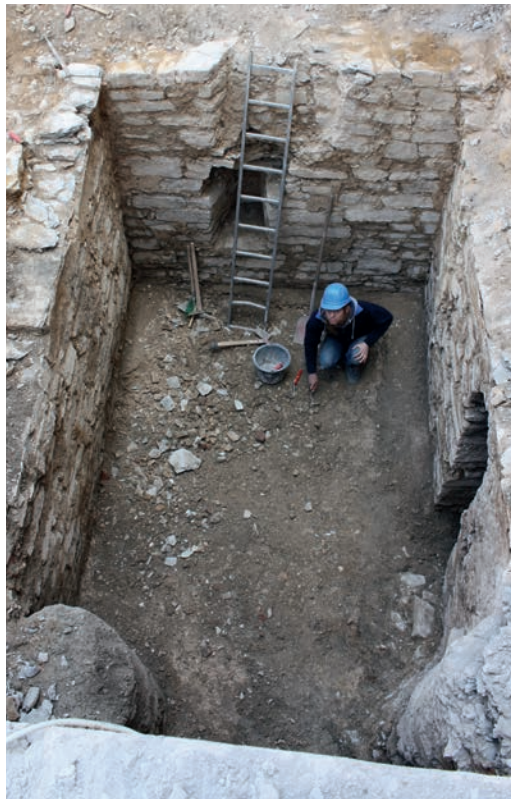
Abb. 4 Der westliche Anbau des späten 12. Jahrhunderts.