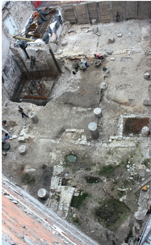
Abb. 2 a) Rekonstruktion der Phase 1, vor 1150; b) der Phase 2, um 1150/1170 (Grafik: LWL-Archäologie für Westfalen/O. Heilmann, E. Manz, S. Spiong).