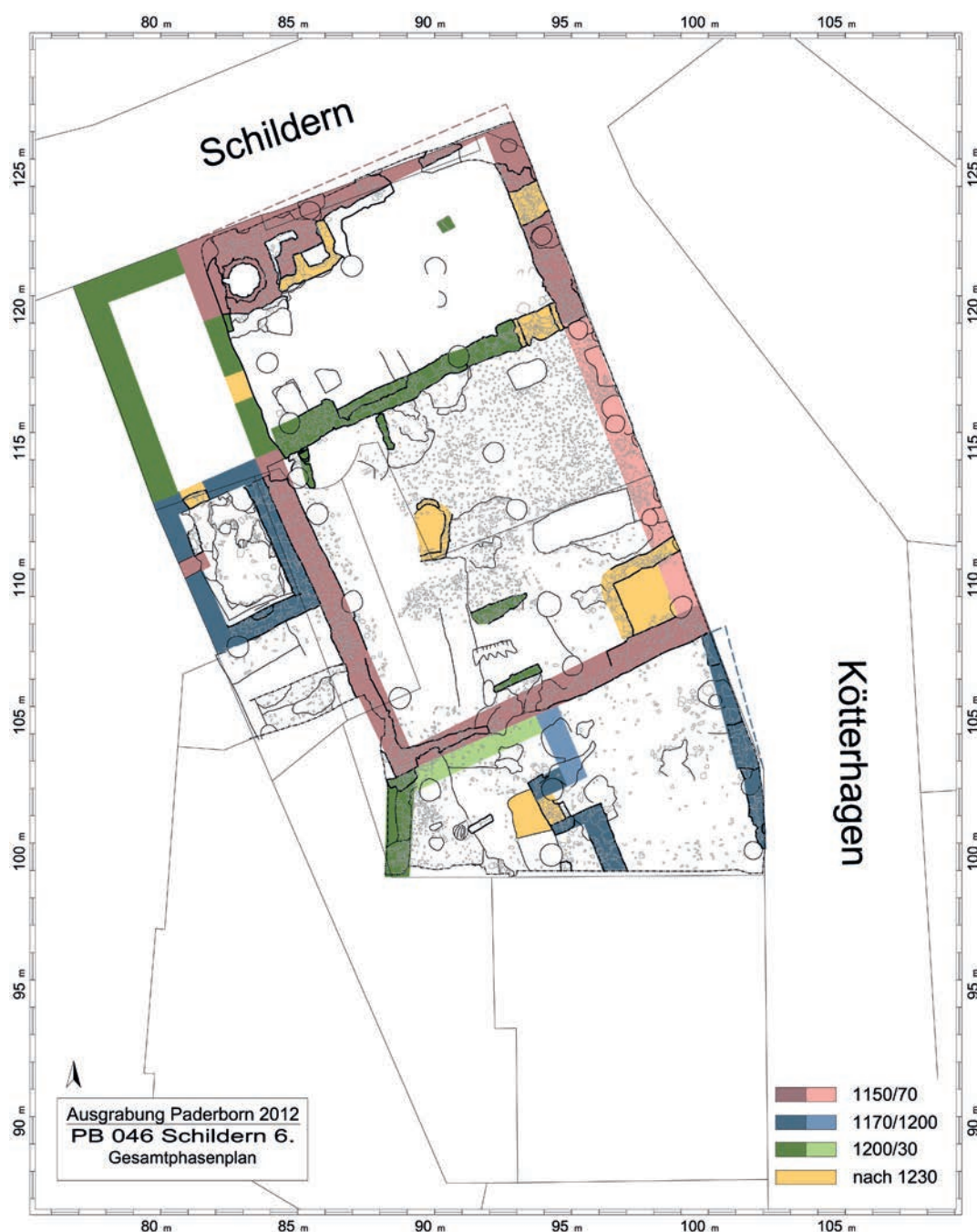
Abb. 3 Übersichtsplan der Grabung mit den Phasen des 12./13. Jahrhunderts und jüngeren Befunden (Grafik: LWL-Archäologie für Westfalen/O. Heilmann, E. Manz, S. Spiong).

Für die Deutung des Gebäudes ist auch seine Lage in der sich entwickelnden Stadt ein wichtiger Aspekt. Das Grundstück liegt einerseits unmittelbar am westlichen Zugang in die Domburg und andererseits direkt am neu entstehenden Stadtzentrum der Bürger. Dieses entwickelte sich über dem zugeschütteten Steinbruch und im bisher nicht oder nur dünn besiedelten Areal zwischen der Marktkirche bzw. der Marktsiedlung im Westen und der Domburg im Osten. Nach dem archäologischen Befund und den Überlegungen zur Topografie stellte das Gebäude deshalb sehr wahrscheinlich den Amtssitz eines hohen Ministerialen des Bischofs, möglicherweise des Stadtgrafen,