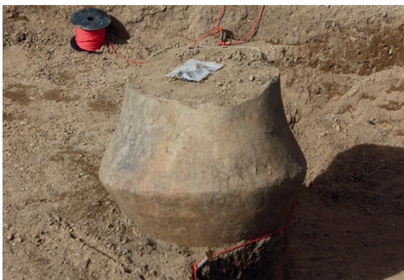
Abb. 3 Bronzezeitliches Brandgrab eines Gräberfeldes bei Stolzenau-Müsleringen (FStNr. 2), Landkreis Nienburg/Weser.

Mehrere Neufunde entlang der Weser beleuchten daneben das 2. und beginnende 1. Jahrtausend v. Chr. näher. Nur 50 m entfernt von der Landesgrenze bei Müsleringen wurde 2011 auf einer Anhöhe in der Weserniederung das Bruchstück einer Radnadel der älteren Bronzezeit gefunden (Abb. 2). Einige jüngerbronzezeitliche Brandgräber traten bei Lehrgrabungen der Universität Hamburg 250 m von der Grenze zu Westfalen zutage. Eigentlich erforscht die Uni in Müsleringen ein Erdwerk der Michelsberger oder Trichterbecherkultur. Im oberen Hangbereich zur Weser wurden die verfüllten neolithischen Gräben aus der Zeit gegen 4000 v. Chr. von mehreren Urnen und Leichenbrandnestern überlagert (Abb. 3).