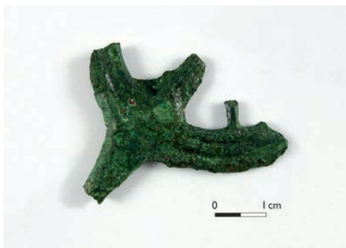
Abb. 2 Radnadel der älteren Bronzezeit aus Stolzenau-Müsleringen (FStNr. 21), Landkreis Nienburg/Weser (M 1:1).

Folgt man der Weser weiter nach Norden, so ist unmittelbar hinter der niedersächsischen Grenze als Kiesfund eine bronzene Schaftlochaxt bei Stolzenau-Müsleringen (Landkreis Nienburg/Weser) zutage getreten, die noch in die späte Jungsteinzeit gehört. Ebenfalls einen Gewässerbezug haben ein Randleistenbeil aus einer Kiesgrube im benachbarten Stolzenau-Diethe und eine Lanzenspitze aus einer Bachniederung bei Stolzenau-Nendorf. Unweit der eisenzeitlichen Moorleiche »Moora« aus dem Uchter Moor wurden deponierte Rinderhör-