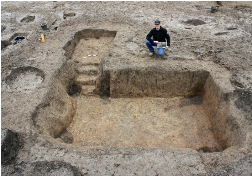
Abb. 4 Blick von Westen auf den Keller des 12. Jahrhunderts.