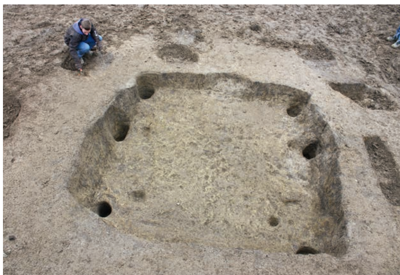
Abb. 1 Ein Blick nach Süden auf das Grubenhaus 1 aus dem 8. Jahrhundert (Foto: LWL-Archäologie für Westfalen/S. Spiong).

Direkt westlich der Grubenhäuser wurden mindestens fünf Hauptgebäude des Hofes lokalisiert, von denen sich vier Pfostenbauten (1 bis 4) überschneiden und damit sicher nicht gleichzeitig existierten. Sie waren etwa 5,0 m bis 6,5 m breit und 11,0 m bis 13,5 m lang und hatten damit eine Innenfläche von 55 m 2 bis 88 m 2 . Die vier sich überschneidenden Pfostenbauten sind mangels Funde innerhalb des von den Grubenhäusern vorgegebenen Zeit-