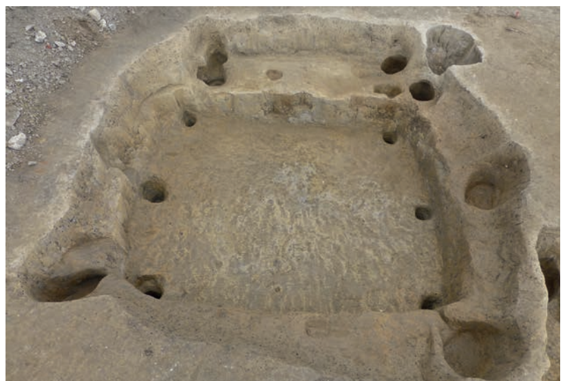
Abb. 3 Ein Blick nach Norden auf die sich überlagernden Grubenhäuser 2, 3 und 5.