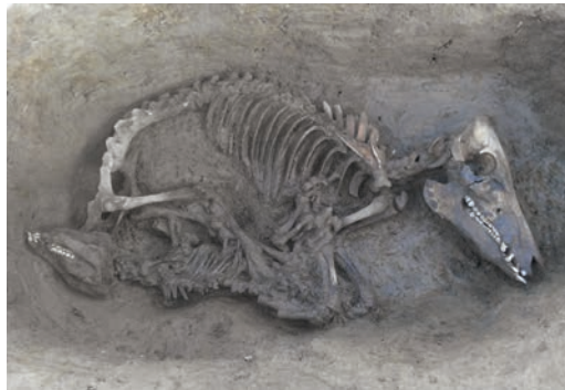
Abb. 5 Grube mit zwei Schweinen. Insgesamt konnten sieben Schweine- und zwei Rindergräber nachgewiesen werden.

Im südlichen Bereich der Grabungsfläche zeichnet sich mit dem deutlich abgesetzten Grubenhaus 6 der ersten Hälfte des 11. Jahrhunderts eine zweite Hofstelle ab, die nur in ihrem nördlichen Randbereich bei der Ausgrabung erfasst wurde. Das Grubenhaus mit deutlichen Standspuren für einen Webstuhl enthielt überwiegend reduzierend gebrannte Kugeltopfscherben mit rechtwinklig abknickenden, abgestrichenen Rändern mit leichter Deckelfalz und eine Scherbe mit pingsdorfariger Bemalung. Die räumliche Distanz zu den Hauptgebäuden und die Gleichzeitigkeit mit Grubenhaus 4 unterstützt die Vermutung, dass es sich hier bereits um das Areal eines anderen Hofes handelt. Der Brunnen am südlichen Grabungsrand gehört ebenfalls schon zu diesem Hof. Keramik aus der Baugrube datiert seine Errichtung zwischen 800 und 1100. Mit der Aufgabe des Brunnens im 13. Jahrhundert ist wahrscheinlich auch der südliche Hof aufgegeben worden. Jüngere Befunde gab es hier nicht.