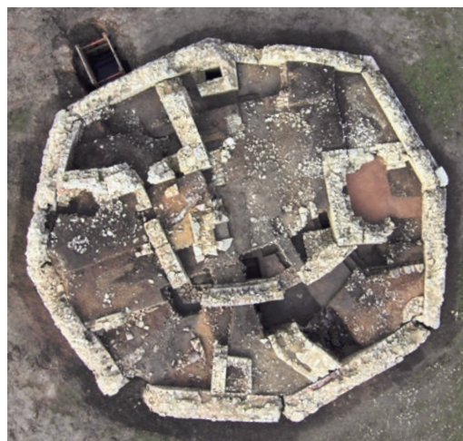
Abb. 2 Das Oktogon und die wichtigsten Befunde seiner Innenbebauung in zeichnerischer Aufsicht nach dem Stand der Ausgrabungen 2013 (Plan: LWL-Archäologie für Westfalen und Vermessungs- und Zeichenbüro Thede).

einfaches Baugerüst ergaben. Dieser Vorgang wiederholte sich nach Bedarf für jede nächsthöhere Lage, deren Abstand in Segment 3 bei 1,55 m lag, sodass das Gerüst mit dem Baufortschritt in die Höhe wuchs. Die nicht mehr benötigten überstehenden Balken wurden abgesägt und zersetzten sich mit der Zeit, sodass Hohlräume, auch Gerüst- oder Rüstlöcher genannt, entstanden, die heute in der Mauer sichtbar sind. Ein weiterer Beleg für das benutzte Holzgerüst findet sich an der Nordseite der Außenschale in Segment 5. Der angelegte Baggerschnitt 17 erbrachte auf der Höhe von 176,50 m ü. NN einen 6,00 m x 4,00 m großen Ausschnitt aus einem 0,30–0,40 m hohen Bauhorizont, bestehend aus festem Mörtel mit kleineren Handquadern. In dieser festen Mörtelschicht konnten Negativabdrücke von ehemaligen Gerüsthölzern, direkt an der Mauer liegend, freigelegt werden. Diesem