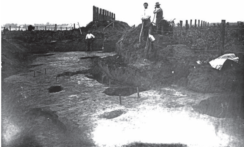
Abb. 2 Vorderansicht der zweiten Rekonstruktion von 1905 (Foto: Altertumskommission für Westfalen).