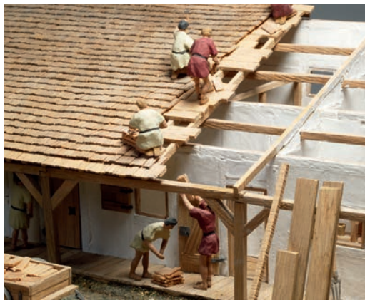
Abb. 6 Baustellenarbeit an einem Kasernengebäude, dargestellt in einem Modell im LWL-Römermuseum (Foto: LWL-Archäologie für Westfalen/ S. Brentführer).

den Rekonstruktionen zu einer Einheit verschmelzen. Hier erhalten dann die Besucher und Besucherinnen am originalen Standort einen umfassenden Eindruck vom Leben im einst bedeutendsten Militärstützpunkt Germaniens unter Augustus. Zusammen mit den »Römerspuren« in der Stadt, dem Flusskampfschiff Victoria, dem LWL-Römermuseum und dem Römerpark Aliso kann Haltern am See auf diese Weise zu einem Römerstandort werden, der sowohl durch die Anschaulichkeit und Erlebbarkeit der historischen Örtlichkeiten als auch durch die innovative Vermittlung von Wissenschaft und antiker Bautechnik eine breite Öffentlichkeit begeistern wird.