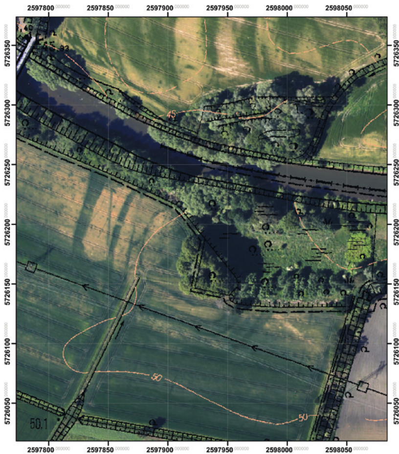
Erstellt im Luftbildarchäologie-Labor des Instituts für Archäologische Wissenschaften der RUB, aufgenommen am 25.05.2011