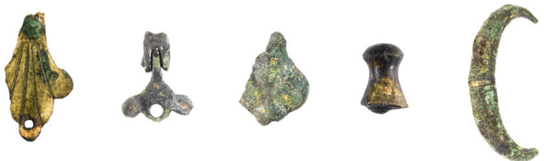
Abb. 5 Lesefunde von der Ackerfläche unmittelbar westlich der »Burgstätte«.

Nach einer lokalen Sage soll der Standort Fuchsspitze/Burgstätte der Vorläufer der ca. 1,7 km lippeaufwärts gelegenen Gräbenhofanlage Haus Dahl gewesen sein. Dies ist nach den historischen Gegebenheiten durchaus möglich. Wir hätten es dann mit dem Stammsitz des gräflichen Geschlechts von Dale zu tun, als dessen erster bekannter Vertreter Graf Gerhard von Dale um 1150 genannt wird.