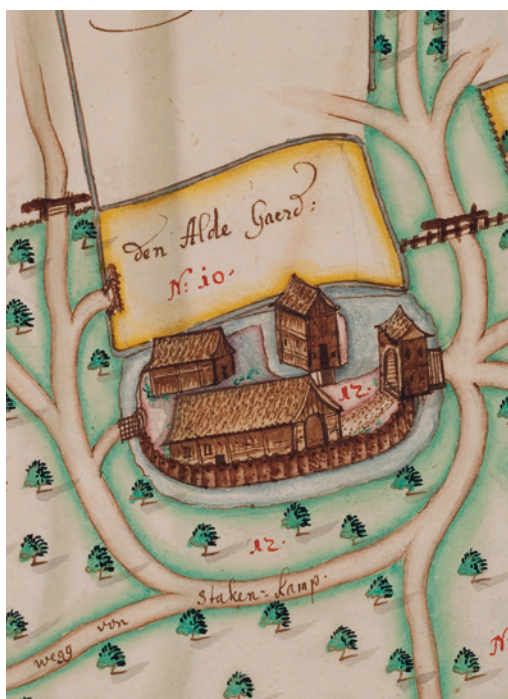
Abb. 3 Darstellung eines Gräftenhofes in einem der Atlanten des Kartäuserklosters Weddern des frühen 18. Jahrhunderts. Anders als bei der Hofwüstung Enghelbractinc lag dessen hier zweigeschossig dargestellte Speiker auf einer eigenen kleinen Speicherinsel.

In Hangenau ist eine Hofwüstung lokalisiert, deren mittelalterliche Strukturen sich unter Wald bewahrt haben und durch eine aktuelle Vermessung dokumentiert wurden. Die Waldbedeckung erstreckt sich nahezu auf den gesamten um 750 m langen und durchschnittlich um 230 m breiten Besitzstreifen der Hufe. Das Waldstück ist im Urkataster von 1825 mit dem Flurnamen Engering bezeichnet und ermöglicht somit eine Identifikation mit dem im ausgehenden ersten Drittel des 14. Jahrhunderts in einem Güterverzeichnis des Stifts Nottuln als Enghelbractinc in den Hangnowe und später, 1437, als Engelbertinch bezeichneten Hof. Von dem Besitz wurden noch im Jahr 1500 grundherrschaftliche Abgaben entrichtet, wobei sich zu diesem Zeitpunkt in der Doppelbezeichnung Engelbertinck/Deypenbrock andeutet, dass die Hufe möglicherweise zunächst von einem anderen Hof aus weiterbewirtschaftet worden ist, bevor sie verwaldete. Entgegen der ursprünglichen Annahme, dass sich die mittelalterliche Hofstelle innerhalb der Parzelle Int Woort – Woort-Blockfluren verweisen im Münsterland fast immer auf die Lage von Hofwüstungen – im Süden der Hufe lokalisieren lassen würde, konnte diese am entgegengesetzten Ende im Norden des Waldstreifens nachgewiesen werden. Der Hof war von einer Ringgräfte umgeben, die im Anschluss an den Nordnordwest-Südsüdost ver-