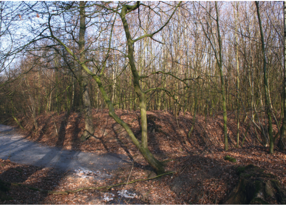
Abb. 2 Die Umgrüftung des ehemaligen Hofes Enghelbractinc unterscheidet sich durch ihre geringe Breite von denjenigen von Niederadelssitzen. Blickrichtung von Osten.

erkennen. Das Arbeitsverfahren, mittels Prospektion der innerhalb der Reihensiedlungen vereinzelt gelegenen Hofwüstungsareale an datierendes Fundmaterial zu gelangen und somit auf archäologischem Weg deren Entstehungszeit einzugrenzen, hat sich teilweise bewährt. Darüber hinaus ist es in zwei bewaldeten Teilarealen gelungen, Gräftenhofwüstungen zu erkennen, deren mittelalterliche Strukturen sich infolge des Wüstfallens erhielten und von denen der vom Kartäuserkloster Weddern gelegte ehemalige Hof Maghelminchus in Dülmen-Limbergen bereits vorgestellt werden konnte (Bergmann 2008, 117 f.).