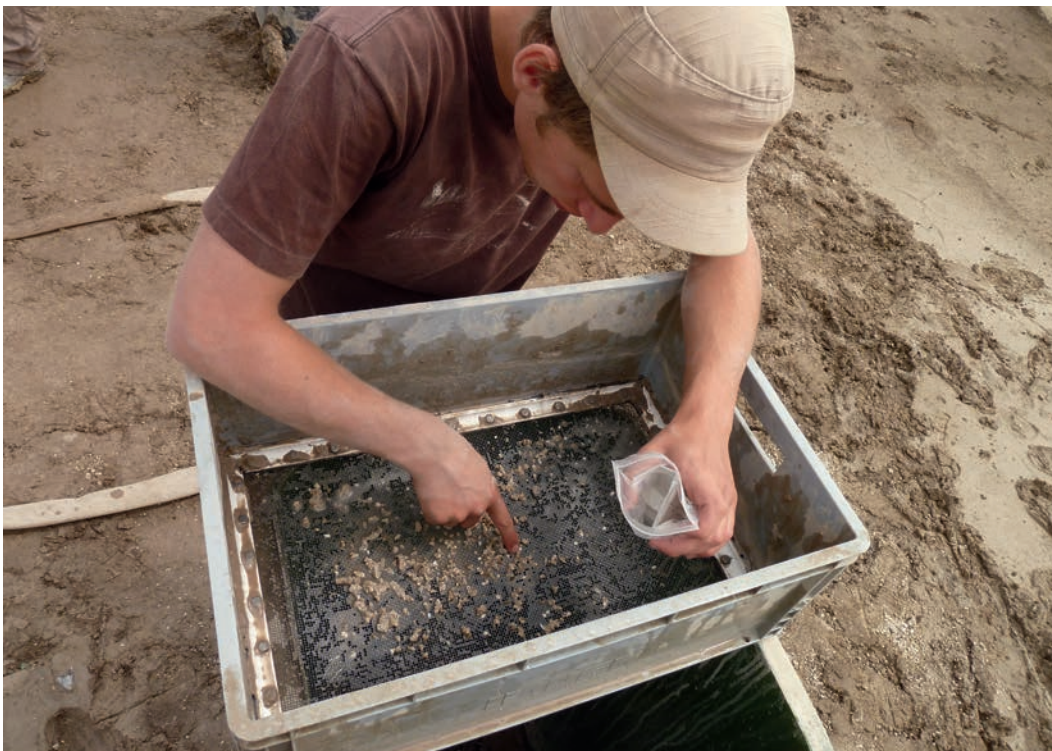
Abb. 1 Beim Schlämmen des Sediments konnten auch kleinste Fundstücke geborgen werden.

Bereits 2011 konnte eine frühmesolithische Fundschicht östlich von Werl-Büderich in der Soester Börde untersucht werden (Baales/Heinen 2012; Heinen 2013). Diese unerwartete Situation in einer seit Jahrtausenden intensiv ackerbaulich genutzten Region erbrachte den für Westfalen ersten Beleg unverbrannter Tierknochen auf einer mesolithischen Freilandfundstelle. Werl-Büderich ist zudem einer von nur vier mesolithischen Fundplätzen in Nordrhein-Westfalen überhaupt, auf denen sich Tierreste erhalten haben.