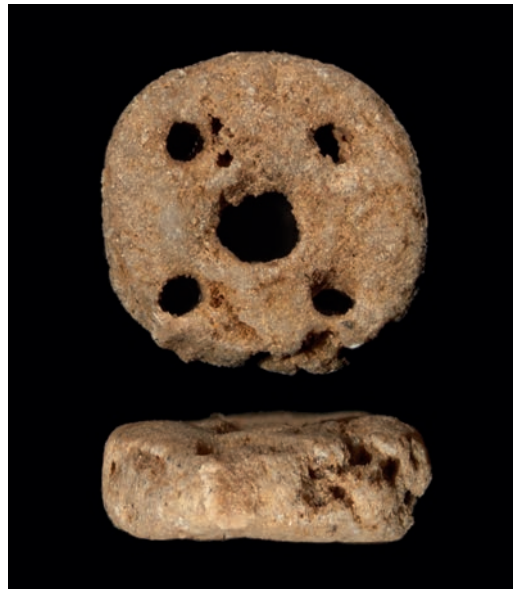
Abb. 5 Die vom Vorplatz der Blätterhöhle stammende Sandsteinperle mit einem Durchmesser von 4,6 mm weist neben der zentralen Durchbohrung noch vier kleinere Durchbohrungen auf.

Im Bereich der mesolithischen Schichten wurden sowohl bei der Grabung als auch beim