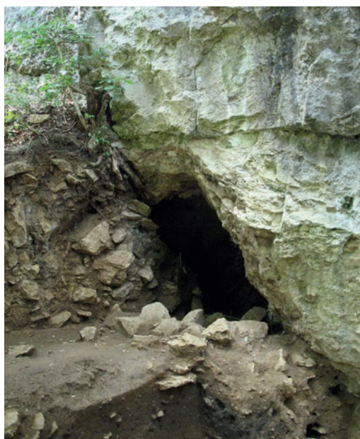
Abb. 4 Bei den Grabungen auf dem Vorplatz wurde 2012 der Eingang zur Blätterhöhle (Hagen) teilweise freigelegt und erwies sich als deutlich größer als bisher bekannt.

Neuere Ergebnisse zeigen, dass auf dem Vorplatz der Blätterhöhle allein für die zweite Hälfte des Präboreals, zwischen 8900 und 8500 v. Chr., eine Sedimentmächtigkeit von mindestens 60 cm vorliegt. Die erste Hälfte des Präboreals ab 9600 v. Chr. wurde bislang noch nicht erreicht. Allerdings ist nach der geophysikalischen Untersuchung (Institut für