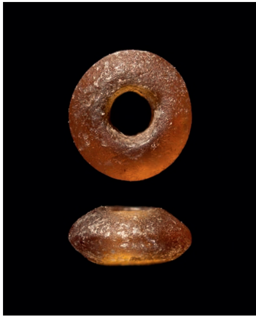
Abb. 2 Diese kleine, nur 3,5 mm im Durchmesser große Perle aus amorphem Siliziumoxid fand sich in einem ausgeschlammten Grabungsabtrag mitten aus der frühmesolithischen Fundschicht (Foto: LWL-Archäologie für Westfalen/S. Brentführer).

Trotz der scheinbar guten Erhaltung der Faunenreste scheiterten zwei 14 C-Datierungsversuche in Mannheim (Klaus-Tschira-Labor für physikalische Altersbestimmung), da in den Knochen kein Kollagen mehr enthalten war. Im Jahr 2012 glückte dann jedoch die zeitliche Einordnung anhand von Laubbaum-Holzkohlen (Bestimmung durch Ursula Tegmeier, Universität zu Köln). Das Ergebnis war überraschend, denn entgegen der noch 2012 vermuteten borealen Zeitstellung der Fundschicht ist sie tatsächlich erheblich älter. Mit