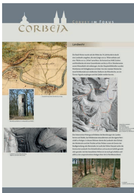
Abb. 5 Spätmittelalterliche Landwehr der Stadt Höxter in der Posterpräsentation (Grafik: LWL-Archäologie für Westfalen/ C. Hildebrand).

Weitere Stationen der Ausstellung bilden die Landwehr der Stadt Höxter, die historische Kulturlandschaft und die urgeschichtliche Besiedlung im Umfeld Corveys. Für diese Themen liefert der Airborne Laserscan ein hervorragendes Datenmaterial. Die im 14. Jahrhundert angelegte Landwehr weist eine Länge von ca. 18 km auf und umschließt eine Fläche von ca. 24 km 2 (Abb. 5). Sie bestand aus einer Wall-Graben-Befestigung mit Knickecke und Warttürmen. In der frühen Neuzeit verlor die Landwehr ihre Funktion und wurde aufgegeben. Durch den Airborne Laserscan konnte ihr bisher unbekannter Verlauf in der Weseraue nördlich von Corvey rekonstruiert werden. In der waldreichen Kulturlandschaft des Corveyer Landes finden sich zahlreiche Spuren der historischen Land-, Wasser- und Forstwirtschaft. Zu den markantesten Relik-