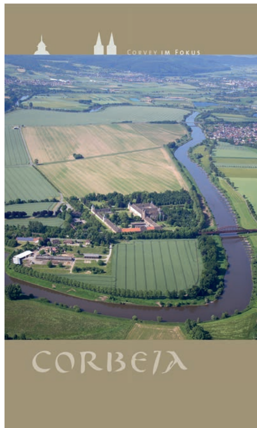
Abb. 4 Ausstellungsbanner mit Kloster und Stadtwüstung im Weserbogen (Layout: LWL-Archäologie für Westfalen/C. Hildebrand).

rolingerzeitliche Wandmalerei im Obergeschoss des Westwerkes (Johanneschor), die christlich umgedeutete Darstellungen aus der antiken Mythologie zeigt. Ebenso einmalig sind die Wandvorzeichnungen (Sinopien) für lebensgroße Stuckfiguren, von denen Bruchstücke gefunden wurden. Während sich das Westwerk den Besuchern heute noch unmittelbar erschließt, lässt sich die komplexe Baugeschichte der 844 geweihten und 1664 abgebrochenen Klosterkirche St. Stephanus und Vitus nur noch anhand der archäologischen Ausgrabungsergebnisse nachvollziehen.