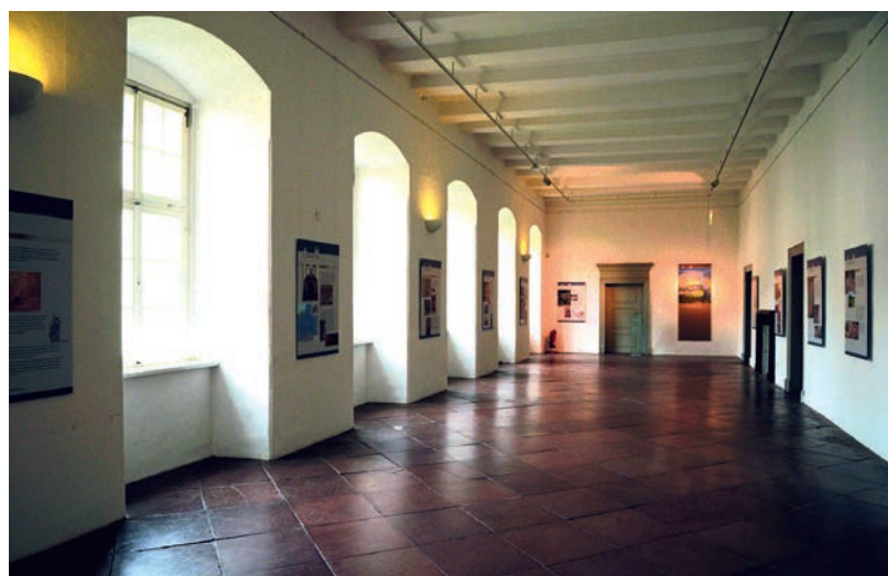
Abb. 2 Ausstellung im zum Westwerk führenden Corveyer »Orgelgang«.