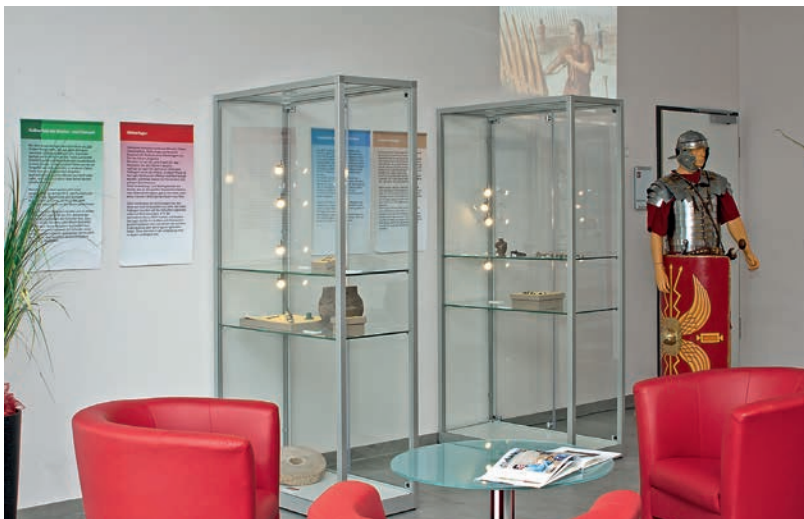
Abb. 1 Teil der Ausstellung im Business Center mit Vitrinen und Beamerprojektion.

Die für eine archäologische Ausstellung ungewöhnliche Situation im Business Center und die damit einhergehende Fokussierung auf die Kunden der diversen Institutionen innerhalb des Gebäudekomplexes als Zielpu-