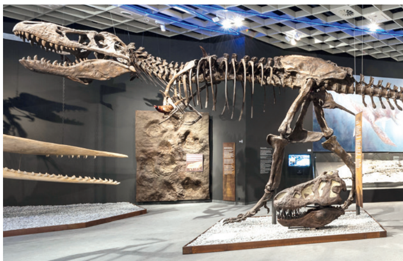
Abb. 1 Das Skelett von Tyrannosaurus rex in der Ausstellung des LWL-Museums für Naturkunde (Foto: LWL-Museum für Naturkunde/B. Oblonczyk).

im Campan und im Maastricht, dem Zeitraum vor 80 bis vor 65 Mio. Jahren, ist es das beherrschende Großraubtier in Nordamerika und in Asien gewesen. Andere Gruppen von großen Raubosauriern, die noch in der frühen und in der mittleren Kreidezeit existierten,