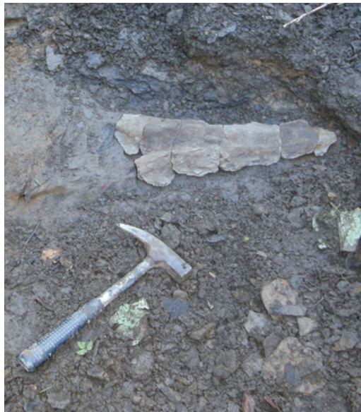
Abb. 2 Der Unterkiefer des Krokodils in Fundposition. Mittlerer Jura, Callovium, vor ca. 160 Mio. Jahren.

Bei dem vollständigeren ersten Exemplar sind Teile des Schädels, des Unterkiefers, mehrere Zähne, Rippen, ein Rollbein und beide Wadenbeine erhalten. Nach den Merkmalen des Schädels und der Zähne stammen die Fossilien von einem großen Raubsaurier aus der Gruppe der Megalosauriden. Derzeit erfolgt eine wissenschaftliche Bearbeitung dieses seltenen Fundes. Mit Megalosaurus bucklandi wurden bereits im frühen 19. Jahrhundert erstmalig die Reste eines Raubsauriers aus dem mittleren Jura von England beschrieben.