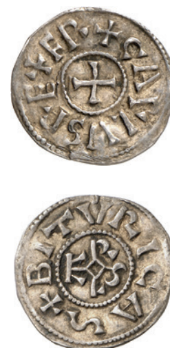
Abb. 3 Denar Karls des Großen aus Bourges (ab 793/794), Vergleichsstück; die Rückseite ist stempelgleich mit dem Fragment aus Beverungen-Herstelle, M 1,5:1 (Fotos: Staatliche Museen zu Berlin, Münzkabinett/L.-J. Lübke).

Ein Denar Karls des Großen aus Aquitanien, dessen produktivste Prägestätten Melle, Toulouse und Bourges waren, an der Weser ist zunächst einmal nicht unerwartbar. Dies gilt zumindest für die Zeit nach den Sachsenkrie-