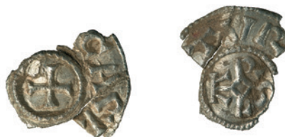
Abb. 2 Das Fragment des karolingischen Denars aus Beverungen-Herstelle, M 1,5:1.

wurde reichsweit 864 dann ein neuer Typ mit GRATIA D-I REX um das Monogramm und dem Namen der Münzstätte um das Kreuz eingeführt. Ab 875 setzte Karl auf die Kreuzseite schließlich den Kaisertitel (+ CARLVS IMP AVC oder + CARLVS IMPERAT), auf die Monogrammseite kam wieder der Münzstättenname.