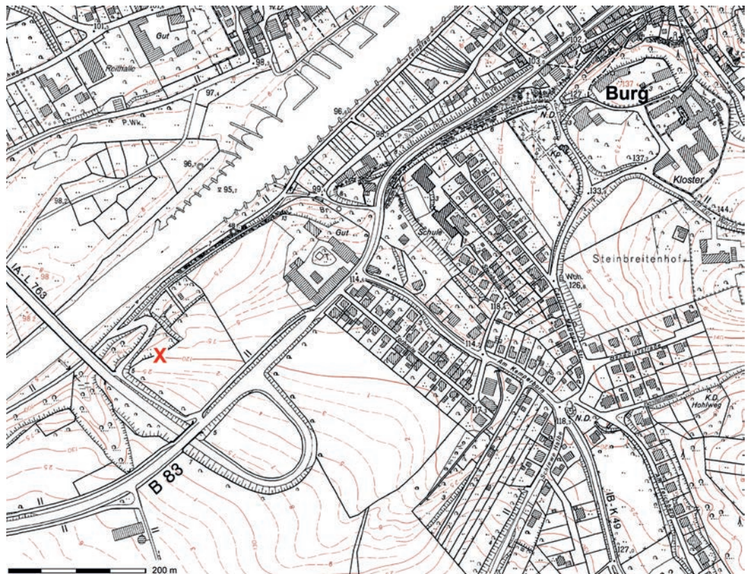
Abb. 1 Beverungen-Herstelle, Fundstelle des karolingischen Denars (X) auf Grundlage der DGK (Grafik: Stadtarchäologie Höxter/R. Schlotthauber; Geobasisdaten: Kreis Höxter).

Das Winterlager wird allgemein im Bereich der hoch über der Weser gelegenen Hersteller Burg, einer Gründung der Paderborner Bischöfe vor 1163, lokalisiert (Abb. 1). Das Areal ist jedoch durch den Schlossbau des 19. Jahrhunderts (1826–1832) und das benachbarte, 1657 gegründete Minoritenkloster stark überformt und lässt keine Spuren einer möglichen frühmittelalterlichen Befestigung erkennen. In Zusammenhang mit Baumaßnahmen auf dem Burgberg wurden von der Außenstelle Bielefeld und der Mittelalter- und Neuzeitarchäologie der LWL-Archäologie bisher vier kleinere Untersuchungen durchgeführt (1964, 1974, 1996, 2002/2003). Neben spärlichen Hinweisen auf eine Nutzung der Fläche