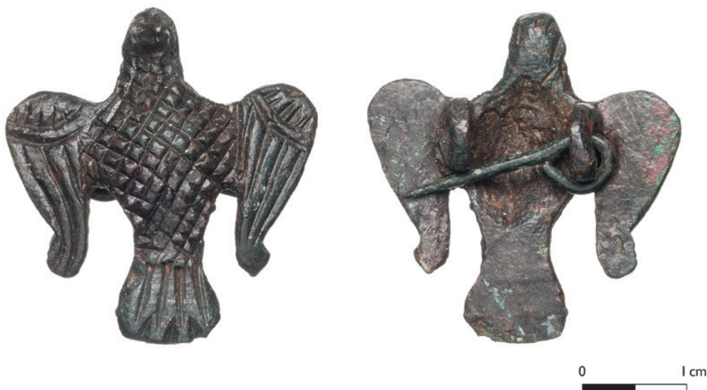
Abb. 1 »Vogelfibel« aus Westerkappeln, Bronze, gegossen, Anfang 13. Jahrhundert, Höhe 3,2 cm.

lustfund aus dem Bereich des Friedhofes vor der Kirche oder aus einem ehemaligen Grab stammt.