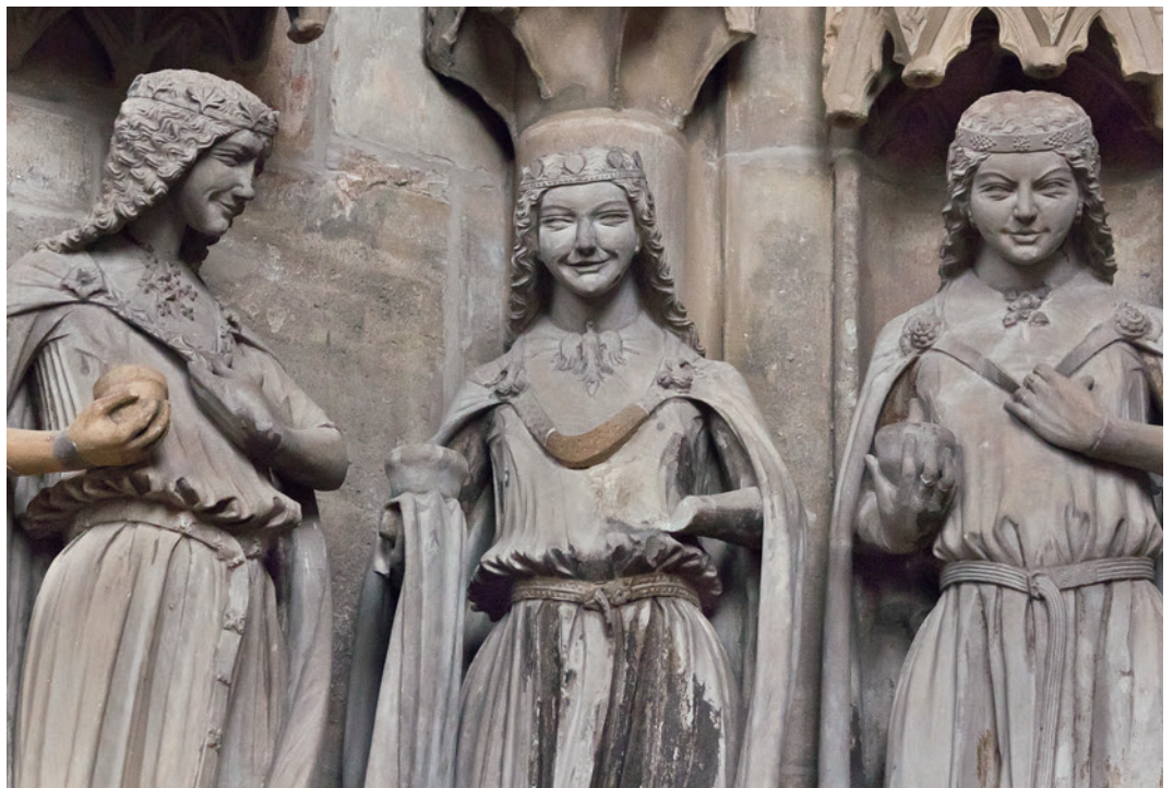
Abb. 4 Adlerbrosche, Darstellung an einer Steinskulptur aus der Serie der klugen und törichten Jungfrauen in der Vorhalle des Doms zu Magdeburg, um 1260.

Ein besonderes Merkmal des Fundes aus Westerkappeln ist der nach vorne gerichtete Blick des Vogels. Heraldische Adlerdarstellungen, bei denen der Raubvogel nach links oder rechts schaut bzw. einen Doppelkopf aufweist, finden sich seit dem Ende des 12. Jahrhunderts und im 13. Jahrhundert in großer Zahl im profanen und sakralen Bereich (Abb. 2, 1–3). Bei den wenigen erhaltenen Schmuckstücken jener Zeit begegnen ebenfalls meist heraldische Abbildungen. Beispiele für eine vergleichbare Frontalansicht eines Adlers finden sich aber nur bei zwei sehr ähnlichen Beschlügen bzw. Anhängern aus Soest (Abb. 2, 4) bzw. von der Hermannsacker-Burg in Schade- wald bei Ebersburg im Harz, die allgemein in das 13. oder 14. Jahrhundert datiert werden. Eine goldene »Adlerbrosche« in Frontalansicht in einer größeren und mehrere Qualitätsstufen über dem Fund aus Westerkappeln stehenden Ausführung mit Goldfiligran und Granulation bzw. Edelsteineinlagen stammt aus dem Sarkophag der Konstanze von Aragón (gest. 1222), der ersten Ehefrau von Kaiser Friedrich II., in Palermo. Ein weiteres Exemplar befindet sich aufgenietet am Hals der sogenannten Goldenen Madonna aus der Zeit um 980 im Essener Münster (Abb. 3). Diese