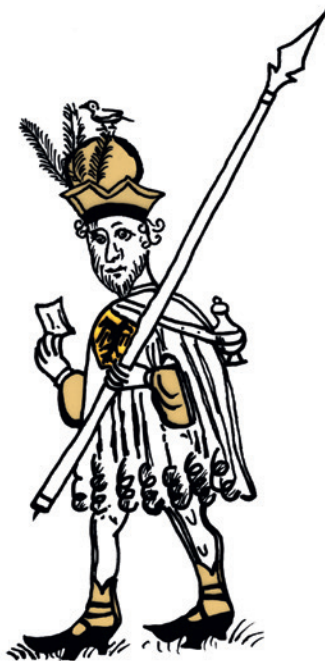
Abb. 5 Der Frankfurter Stadtbote Henchin Hanauwe von 1439, Umzeichnung der Federzeichnung aus dem Frankfurter Bürgermeisterbuch (Grafik: B. Thier nach Schneidmüller 1989, Abb. 5).

13. Jahrhundert auch die Städte eigene Boten. Da viele Personen deren Geleitschreiben nicht lesen konnten, trugen sie, um zu ihrem eigenen Schutz als Amtspersonen erkennbar zu sein, sichtbare Botenabzeichen, die vielfach mit dem Reichsadler oder dem Stadtwappen verziert waren (Abb. 5). In späteren Zeiten waren Pilger- und Bettlerabzeichen, Kennzeichen für Juden und Prostituierte, diverse Berufsabzeichen und besonders Amtszeichen ( signa ) der herrschaftlichen oder städtischen Spielleute, die vielfach als reisende Musikanten die Funktion von Boten übernahmen, weit verbreitet. Erwähnt werden derartige Abzeichen bereits 1377 (Frankfurt) bzw. 1378 (Bern). Offiziell angestellte Spielleute, die vielleicht ebenfalls schon solche Zeichen trugen, lassen sich bereits 1355 in Prag nachweisen.