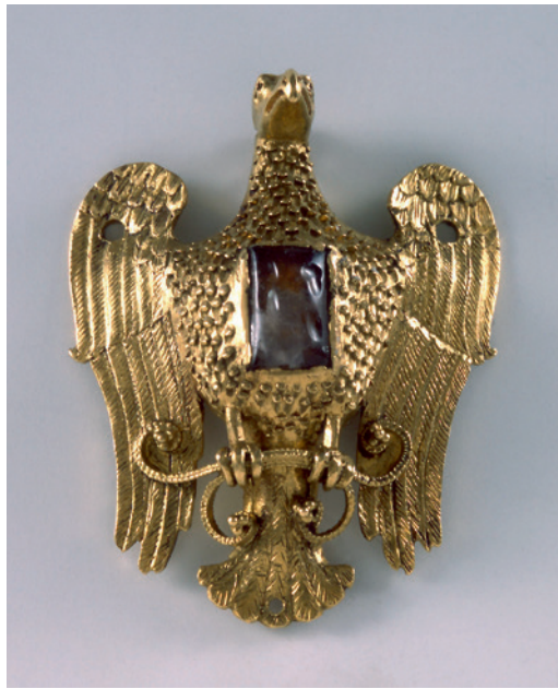
Abb. 3 Adlerbrosche, Gold mit gefasstem Edelstein, Anfang 13. Jahrhundert, Höhe ca. 5 cm vom Hals der Goldenen Madonna im Domschatz Essen.

Da bisher offenbar keine direkte Parallele zu dieser einfachen, gegossenen »Adlerfibel« vorliegt, gestaltet sich eine Datierung des unstratifizierten Fundes schwierig. Sie gehört offenbar nicht zu den massiv gegossenen, plastischen, karolingisch/ottonischen Tierfibeln des 8. bis 10. Jahrhunderts. Zwar erscheinen Adlerdarstellungen auf runden, teilweise durchbrochenen Scheibfibeln des 10. und 11. Jahrhunderts, aber Ähnlichkeiten zum Stück aus Westerkappeln bestehen nicht. Die berühmten und kostbaren goldenen Adler-Pfauen-Fibeln des zweiten Viertels oder der