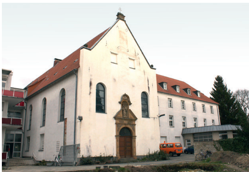
Abb. 1 Südflügel des ehemaligen Landeshospitals im bis 1833 bestehenden Kapuzinenkloster. Die Kirche wurde 1659 geweiht. Im Vordergrund Grabungsschnitt 14.

Es war der Paderborner Dompropst Arnold von der Horst, der 1628 die ersten Kapuzinen aus Köln kommen ließ. Bereits wenige