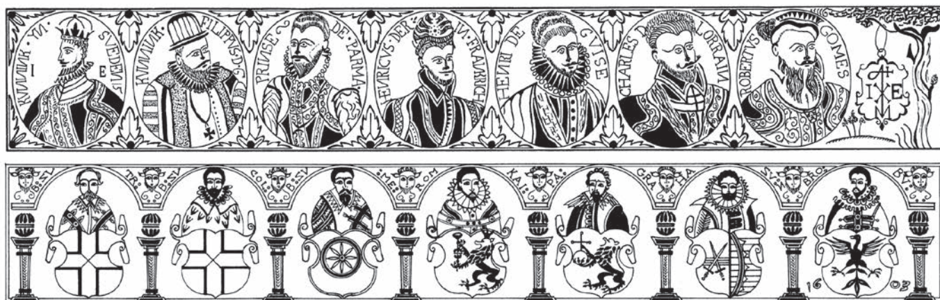
Abb. 5 Abrollungen der Frieze mit den »Verteidigern des katholischen Glaubens« (oben) und den deutschen Kurfürsten (unten) (Grafik: Kohnemann 1982, 188; Bearbeitung: LWL-Archäologie für Westfalen/O. Heilmann).

mit dem Titel »Die Bauernhochzeit oder die zwölf Jahreszeiten«, die 1546/1547 vom Nürnberger Kleinmeister und Dürer-Schüler Hans Sebald Beham herausgegeben wurde. Für die Auflage dieses Werkes auf Steinzeug Westwälder Art gibt es weltweit keine Parallelen. Der Krug trägt mehrfach die Initialen »IE« und datiert inschriftlich auf 1590.