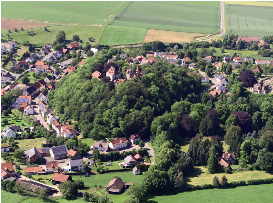
Abb. 1 Die malerische Höhenburg Calenberg, aufgenommen am 6. Juni 2014.

Zur Dokumentation wurden die laublosen Wintermonate genutzt, um Topografie, Erhaltungszustand und architektonische Details der Bauten nahezu ungestört vom Bewuchs aus verschiedenen Blickwinkeln aufzunehmen. Im Sommer oder Herbst aufgenommene Luftbilder zeigen demgegenüber häufig die farbenprächtige, quasi malerische Seite der Monimente. Als Beispiel sei hier die um 1250 durch einen Familienzweig der Herren von Holthusen gegründete, 1299 erstmals genannte Höhenburg Calenberg angeführt (Abb. 1). Die Burg sicherte im Mittelalter den Grenzraum an Diemel und Twiste. 1868 ging die verfallene Burg in den Besitz der Familie Schuchardt über. Nach Plänen des Kölner Architekten und Diözesanbaumeisters Heinrich Wiethase entstand unter Einbeziehung alter Baustrukturen zwischen 1880 und 1882 im