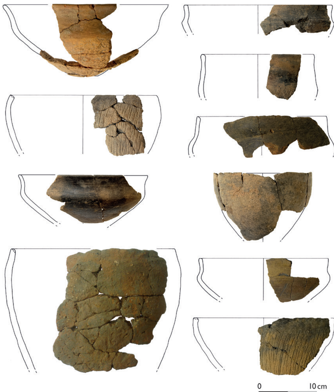
Abb. 4 Verschiedene Beispiele für Gebrauchskeramik, u. a. Schulterschalen, Kumpfe, polierte s-förmige Schalen und grobkeramische Töpfe (Zeichnungen: Stadtarchäologie Soest).

denn Beispiele wie die Lappenschale in Dorsten-Holsterhausen oder ganz allgemein die grobkeramischen Rautöpfe zeigen den Einfluss aus Niedersachsen, Nordhessen und Ostwestfalen auf das Untersuchungsgebiet. Die dennoch tendenziell größere Westorientierung der Soester Fundstellen wird einerseits durch die Anlage von Kegelstumpfgruben bereits zur mittleren Eisenzeit betont. Zum anderen fallen aber auch zwei Schulterschalen auf, für welche lediglich am Niederrhein vergleichbare Beispiele gefunden werden konnten, wohingegen Parallelen in Ostwestfalen fehlen.