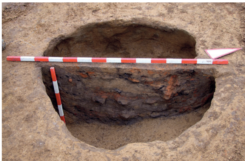
Abb. 2 Das Ostprofil der Kegelstumpfgrube zeigt eine deutliche Unterschneidung und eine gemuldete Sohle. Durch natürlich und anthropogen verursachte Erosion war nur noch etwa ein Drittel des Befundes erhalten.