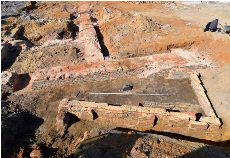
Abb. 3 Teilfreilegung der Südmauer mit den Nischen (Foto: Jentgens & Partner Archäologie/R. Machhaus).