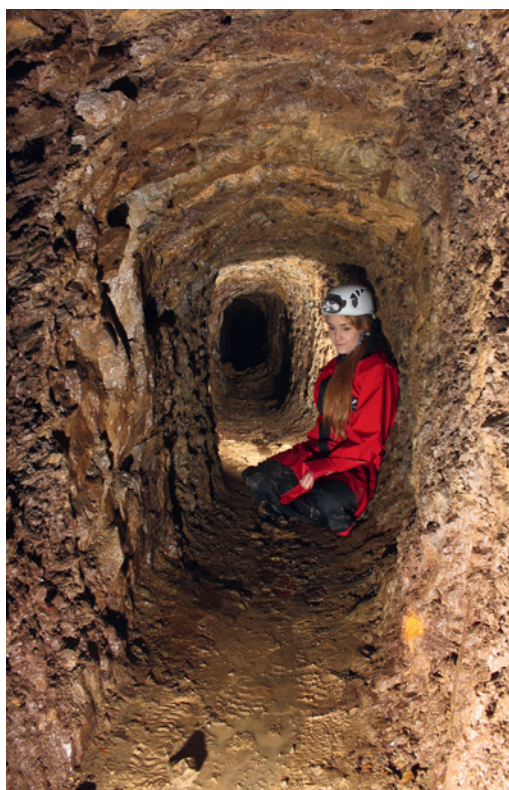
Abb. 3 Blick von Norden auf einen Streckenabschnitt mit langrechteckigem Querschnitt.

bei der Anlage der Baugrube unbemerkt abgetragen. Dabei gingen vermutlich auch mindestens 10 m der untertägigen Strecke verloren.