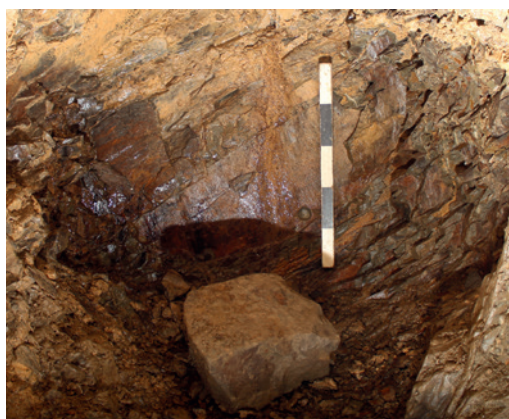
Abb. 4 Blick von Nordosten auf die Ortsbrust und eine Bohrlochpfeife neben dem Halbmetermaßstab.

Der Stollen wurde zunächst von Norden aus in annähernd südliche Richtung in den anstehenden devonischen Schiefer aufgeföhren. Die Streckenprofile waren hier langoval (Abb. 3), während sich auf den Stößen keine Vortriebsspuren befanden. In besonders harten