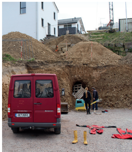
Abb. 1 Blick von Norden auf das Mundloch des Stollens in der Böschung der Baugrube in Schwelm am Winterberg.

Die Fundstelle befindet sich am nordexponierten Hang des Winterbergs. Das Mundloch lag ursprünglich bei ca. 310 m ü.NN. Allerdings wurde es samt provisorischer Abdeckung (Bleche) bzw. Sicherung (Ziegelverbau)