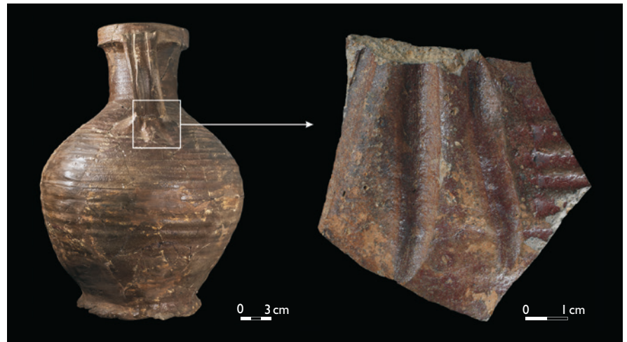
Abb. 1 Grubenareal Ratzenscheid. Scherbe der Sondage 2016 (rechts) und zum Vergleich ein Gefäß derselben Ware der Bergbauwüstung Altenberg bei Müsen.

Bereits die Begehungen auf dem Ratzenscheid lieferten Wandscherben hart gebrannter grauer bzw. oxidierend gebrannter Irdenware des 13. Jahrhunderts. Eine kleine Sondage in einem neuzeitlichen Haldenkörper im Zentrum des Bergbauareals erbrachte erwartungsgemäß neben jüngeren Bergbauabfällen auch mittelalterliche Scherben, darunter ein Henkelansatz aus dunkelbraun engobiertem Protosteinzeug, welches sich nahezu identisch auf der bekannten Bergbauwüstung Altenberg bei Müsen findet (Abb. 1). Damit ist archäologisch das 13. Jahrhundert auf dem Ratzenscheid belegt. Inwieweit und vor allem wie gut eine mittelalterliche Befunderhaltung existiert, konnte mit dieser kleinflächigen Sondage freilich nicht geklärt werden. Dies