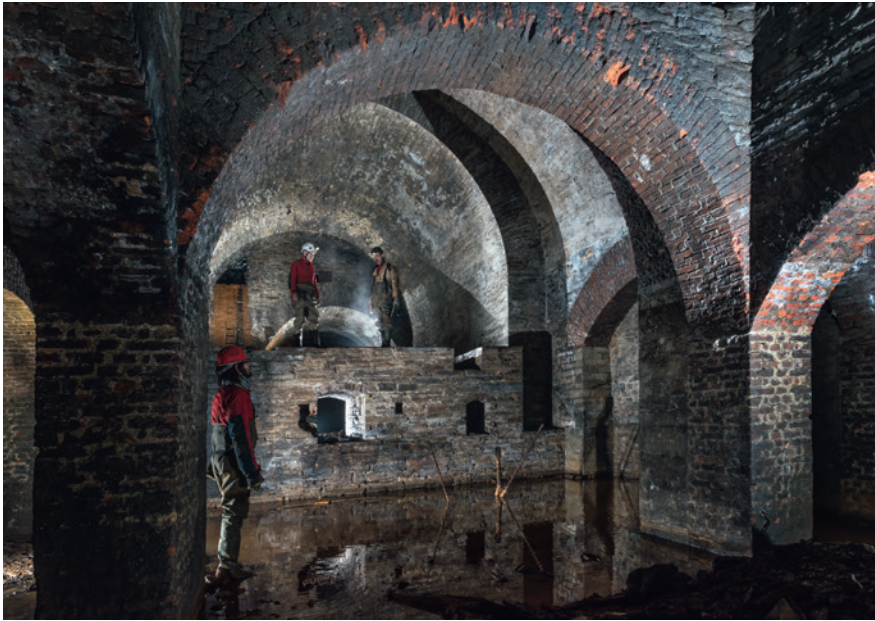
Abb. 3 Blick in die Schachthalle der Grube Landeskronen auf das Dampfmaschinenpodest im Hintergrund und den wassergefüllten Schacht im Vordergrund.

Die Dampfmaschine samt ihrer Leistungsdaten wurde in einem zeitgenössischen Dokument detailliert beschrieben, das im Landesarchiv NRW (Signatur »Oberbergamt Bonn Nr. 493, Dampfmaschine«) aufbewahrt wird. Hierzu gehörte wohl auch eine Zeichnung der Maschine, die aber leider verloren gegangen ist. Auf Grundlage der montanarchäologischen Untersuchungen, in Kombination mit den historischen Quellen, wird eine Rekonstruktion des technischen Denkmals inklusive Dampfmaschine angestrebt. Hierzu wurde das gesamte Grubengebäude beschrieben, kleine Sondagegrabungen realisiert und das Bodendenkmal in Details abgelichtet. Parallel erfolg-