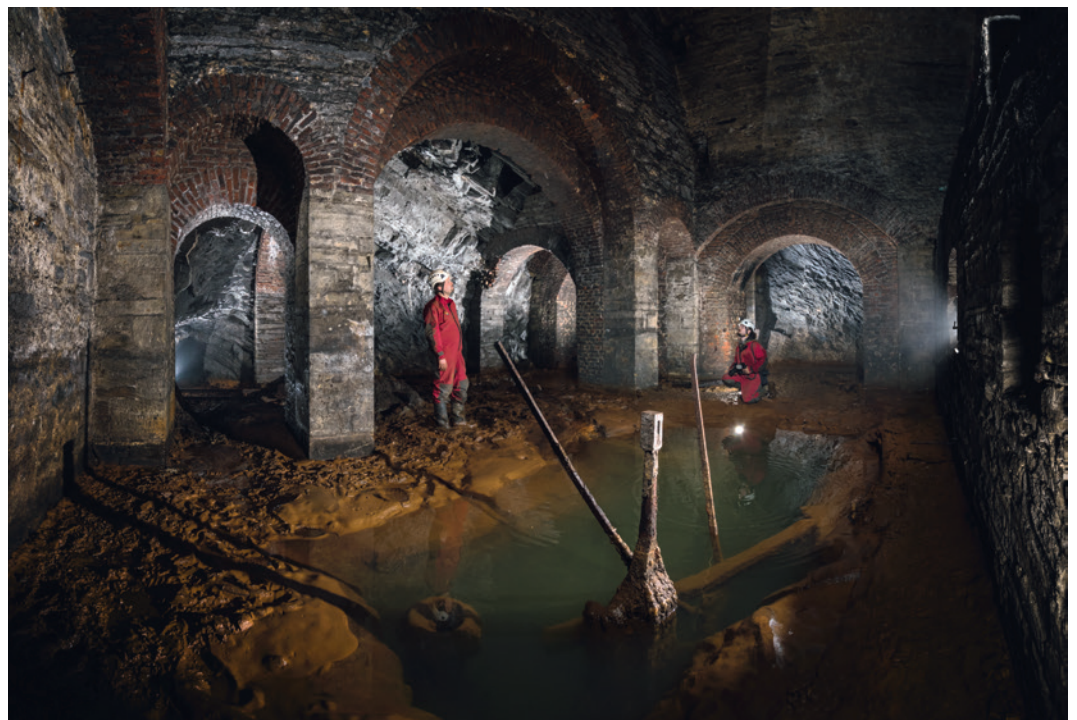
Abb. 4 Blick in die Schachthalle Grube Landeskronen mit dem wassergefüllten Schacht im Vordergrund und der Kante des Dampfmaschinenpodestes am rechten Bildrand.