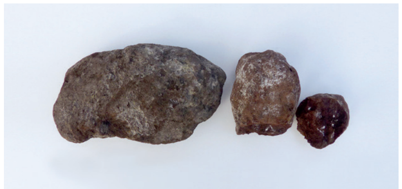
Abb. 2 Torfige Sedimentbrocken – gesammelt von der Überkornhalde, M 1:4.

Aus der Sandgrube in Vreden-Große Mast stammen ebenfalls drei Werkzeuge. Neben einem retuschierten Abschlag ist ein Geradschaber zu erwähnen, der aus einem länglichen Abschlag hergestellt worden ist. Außerdem wurde ein bifazial bearbeitetes Kerngerät mit verdicktem Griffende gefunden, das vielleicht als eine Art Fäustel anzusprechen ist (Abb. 3).