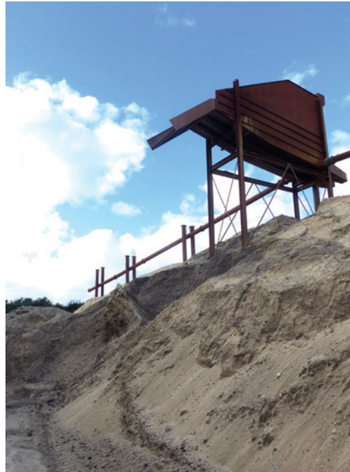
Abb. 1 Sandgewinnungsanlage in Vreden-Große Mast.

funde aus dem Münsterland. Sie spricht aber dafür, dass es sich bei dem Fundniederschlag nicht um die Folge eines einzigen Ereignisses handelt.