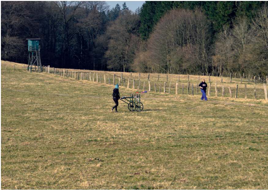
Abb. 3 Blick über die Fundstelle von Brilon-Altenbüren.