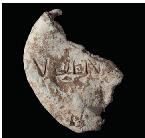
Abb. 1 Pudens-Inschrift auf einem Bleiobjekt aus Brilon-Altenbüren, M 1:1 (Foto: LWL-Archäologie für Westfalen/S. Brentführer).

Der andere Unternehmer ist uns als Pudens bekannt. Ein Bleibarren aus einem Schiffswrack, welches um die Zeitenwende vor der Nordküste Sardinien gesunken ist, trägt einen Stempel mit folgender Inschrift: PVDEN-