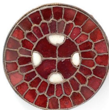
Abb. 4 Dortmund-Asseln, Grab St 18, Almandinscheibenfibel mit Dekor in Form eines griechischen Kreuzes, weißer Glasfluss in den Kreuzarmen (gedreht), M 1:1 (Foto: Stadtarchäologie Dortmund/G. Wertz).

Abgesehen von der Kreuzfibel und dem als Kirche gedeutetem Gebäude vom Gaulskopf sowie dem kreuzförmigen Beschlag aus Raesfeld-Erle mehren sich in jüngerer Zeit weitere Hinweise darauf, dass es in Westfalen bereits vor den Sachsenkriegen Christen gegeben hat. Aufsehen erregte vor allem der Fund einer Glockengussgrube in Dülmen (Kreis Coesfeld), die anhand von 14 C-Daten in den Zeitraum des ausgehenden 7. bis zur Mitte des 8. Jahrhunderts datiert werden muss (Jentgens/Peine 2016). Es hat hier also bereits weit vor den Sachsenkriegen einen Kirchenbau mit Glockenturm und demzufolge auch Christen gegeben.