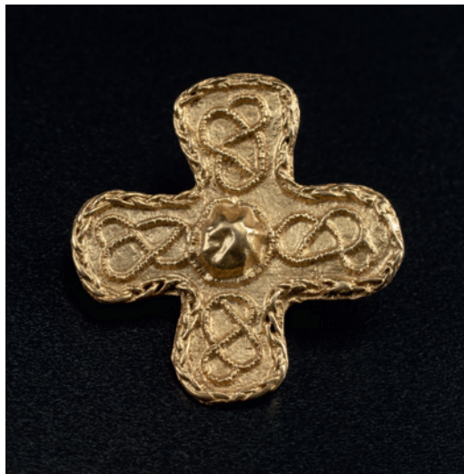
Abb. 2 (rechts) Kreuzförmiger Beschlag aus Raesfeld-Erle, Grab I, M 1:1 (Grafik: LWL-Archäologie für Westfalen).