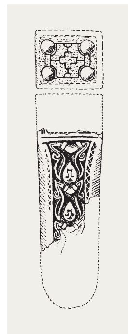
Abb. 5 Soest, Grab 106, Beschlag einer Wadenbindengarnitur mit Kreuzmotiv, M 1:1 (Grafik: Peters 2011, Taf. 22).

Bisher sind es nur wenige Befunde und Objekte, die darauf hindeuten, dass das Christentum bereits in der Merowingerzeit, also weit vor der Missionierung zur Zeit Karls des Großen, Spuren in Westfalen hinterlassen hat. Nach den Fundorten der genannten Funde betrifft dies vor allem die Randzonen zum bereits seit dem 6. Jahrhundert christlichen Kern-Frankenreich. Sind mobile Objekte wie die Fibeln und Beschlüge noch durch Zufälle, Migration, Handel, Gabentausch oder anderes zu erklären, so zeigen sie zumindest Kontakte der Elite mit christlich geprägten Gesellschaften. Vor allem für die Besitzer der kreuzverzierten Schmuckstücke aus den späteren Hellwegstädten Dortmund und Soest ist dies naheliegend. Deutlicher sind dagegen die ortsgebundenen Befunde in Dülmen und auf dem Gaulskopf in Warburg-Ossendorf zu bewerten, die ohne christlich geprägte Erbauer und Nutzer nicht denkbar sind.