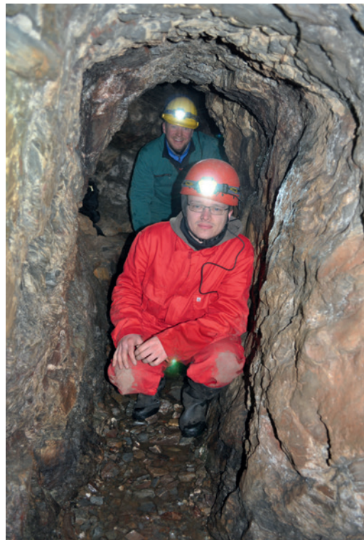
Abb. 2 Vermessungsarbeiten im Venetianerstollen.