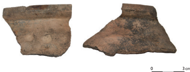
0 3 cm

Der Venetianerstollen kann damit erwartungsgemäß in die hochmittelalterliche Aufschwungphase des Erzbergbaus gestellt werden, wie etwa auch die ältesten Datierungen des Erzbergbaus in Dippoldiswalde (Sachsen, Erzgebirge) oder Villanders (Südtirol) aus der Mitte des 12. Jahrhunderts stammen. Ältere Nachweise mittelalterlichen Bergbaus aus dem Schwarzwald, vom Rammelsberg und andernorts finden zwar in der montanarchäologischen Forschung immer ein großes Echo. Dies darf aber nicht darüber hinwegtäuschen, dass allgemein erst im Hochmittelalter der Erzbergbau in Umfang und technischer Ausführung wieder den Stand der Antike erreicht