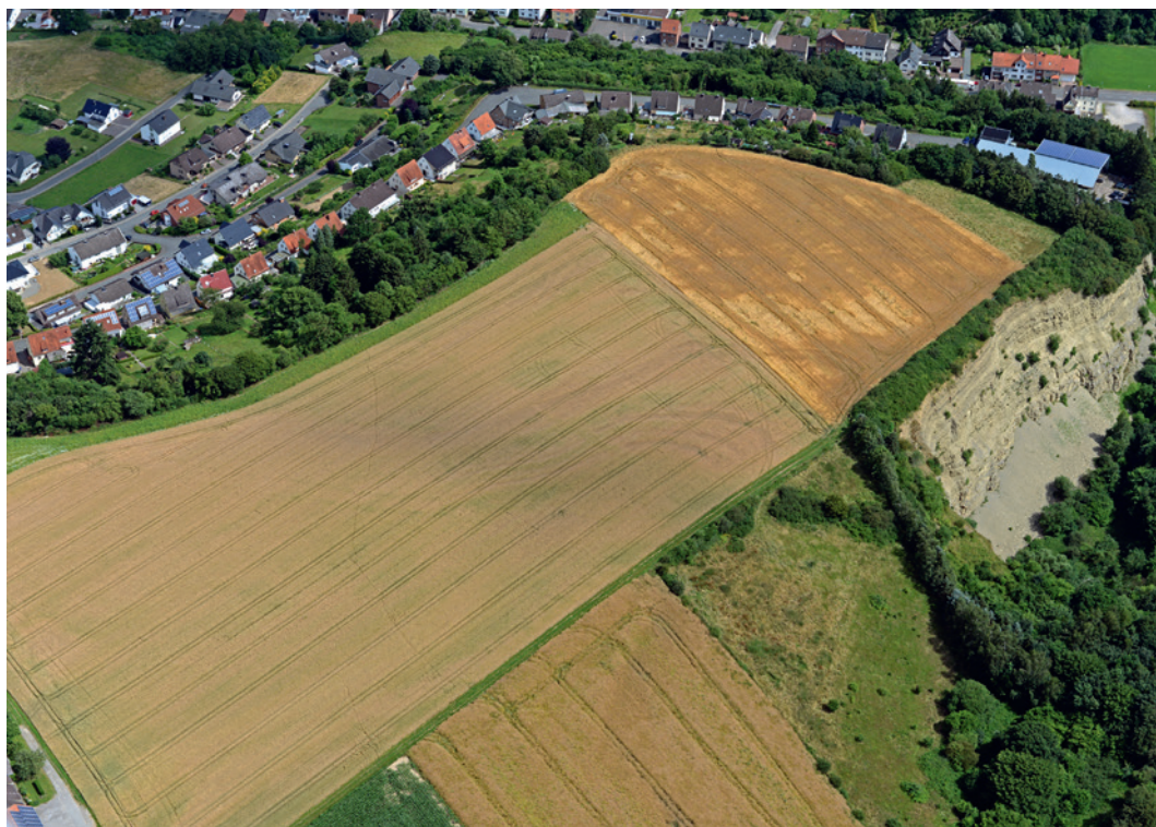
Abb. 3 Der jungneolithische Abschnittswall mit Doppelgräben als positive Bewuchsmerkmale im Wintergetreide bei Beverungen-Dalhausen, aufgenommen am 12. Juli 2016.

Im Frühjahr trafen sich der Autor und Kollegen der LWL-Archäologie für Westfalen in Rahden und überlegten gemeinsam, wie die Luftbildarchäologie am besten in die Feldforschung und Bodendenkmalpflege integriert werden kann. Konkrete Maßnahmen zur kontinuierlichen, engen und effektiven Zusammenarbeit wurden besprochen. Die Ver-