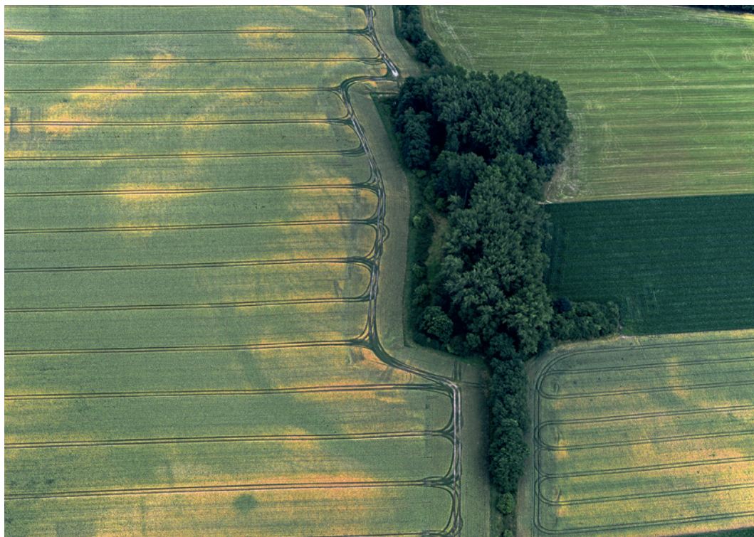
Abb. 2 Die Grabenstruktur bei Willebadessen-Peckelheim als positive Bewuchsmerkmale im Wintergetreide, aufgenommen am 12. Juli 2016.