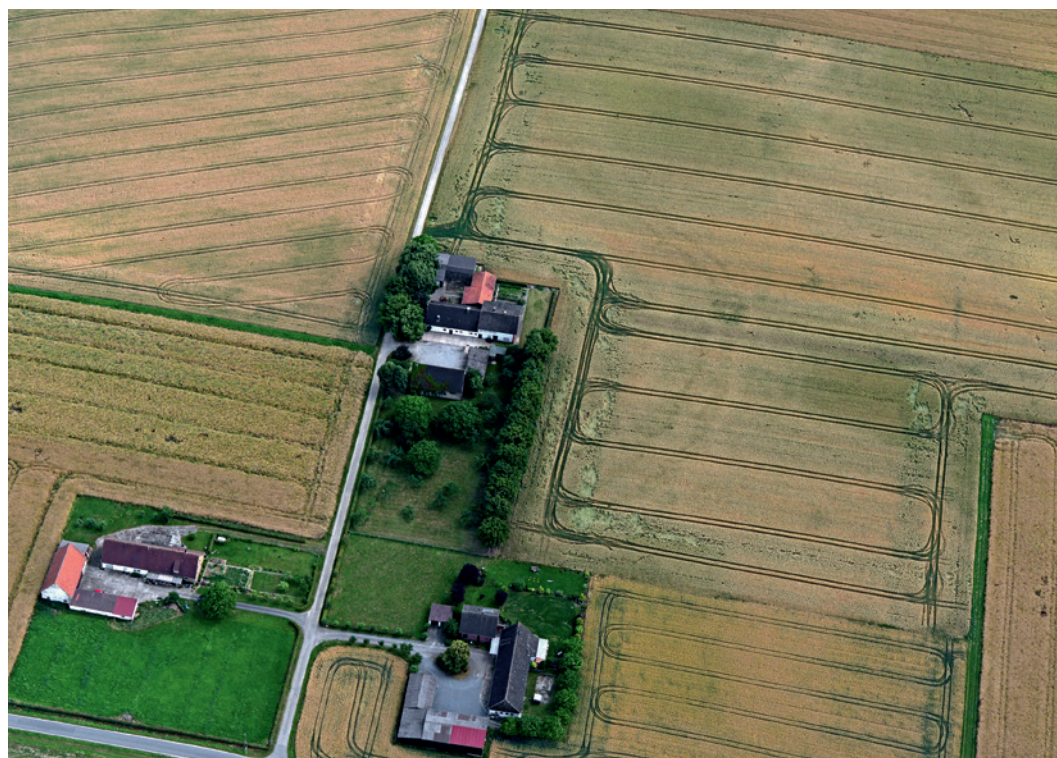
Abb. 1 Das neolithische Erdwerk bei Willebadessen-Niesen mit den Spuren von Doppelgräben, die sich als positive Bewuchsmerkmale im Wintergetreide abzeichnen, aufgenommen am 12. Juli 2016.

in flachen Feldern zu finden sind, im Sommer zum Vorschein. Die meisten bis Mai ausgeprägten Bewuchsmerkmale verschwanden im Juni und Juli und nur wenige Spuren wurden im ausreifenden Wintergetreide ab Mitte Juli beobachtet. Erst ab Mitte August gab es heißes und trockenes Wetter – die Saison für Wintergetreide war dann jedoch schon vorbei. Wohl durch das ungünstige Wetter bedingt wurden anschließend statt Sommergetreide im diesem Jahr oft Mais und Raps angebaut. Dadurch wurde die Chance, archäologische Spuren durch Bewuchsmerkmale zu entdecken, enorm verringert.