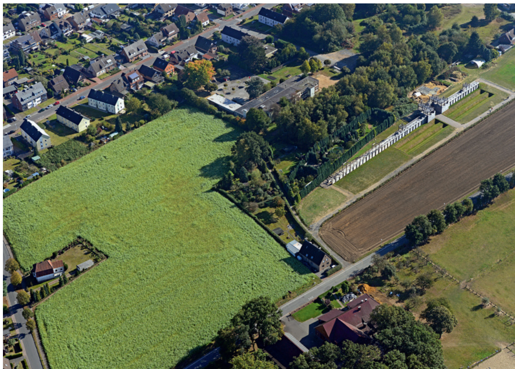
Abb. 6 Nordwestecke und Nordtor des römischen Hauptlagers in Haltern am See als Kombination von Bewuchs- und Schattenmerkmalen, aufgenommen am 16. Oktober 2016.

ben, die jeweils eine Breite von ca. 1,5 m und einen Abstand von ca. 7–8 m aufwiesen. Da geologische Spuren hier sehr dominant sind, war der archäologische Befund relativ schwach erkennbar. Der Abschnittswall, der wohl ebenfalls ins Jungneolithikum zu datieren ist, hat eine Länge von ca. 200 m und umfasst ein Plateau mit einer Gesamtfläche von über 43.000 m 2 .