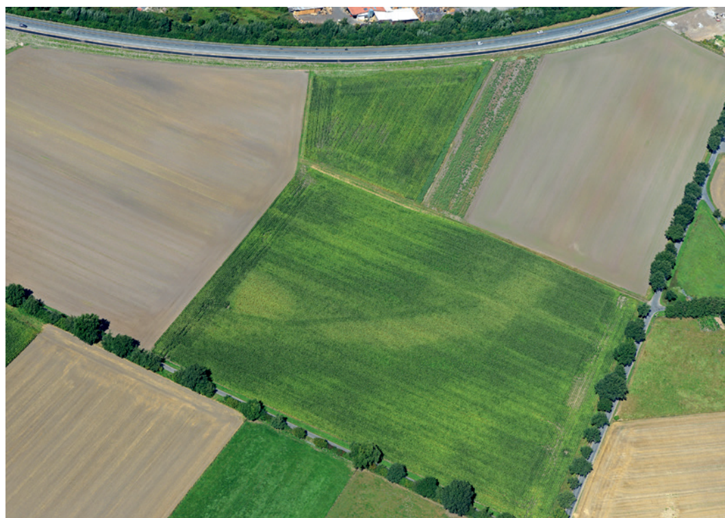
Abb. 4 Das jungneolithische Erdwerk auf dem Schüttberg bei Brakel als positive Bewuchsmerkmale im Wintergetreide, aufgenommen am 12. Juli 2017.