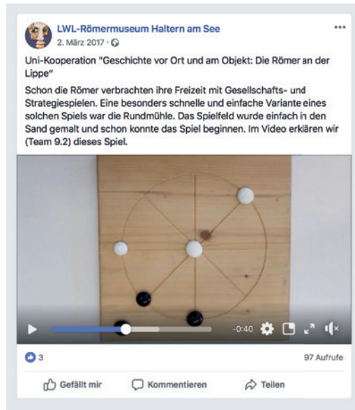
Abb. 4 Dieser Facebook-Beitrag erklärt die römische Rundmühle (Grafik: LWL-Römermuseum).

Möglichkeit, die verschiedenen Posts auf der Facebook-Seite des LWL-Römermuseums aufzurufen.