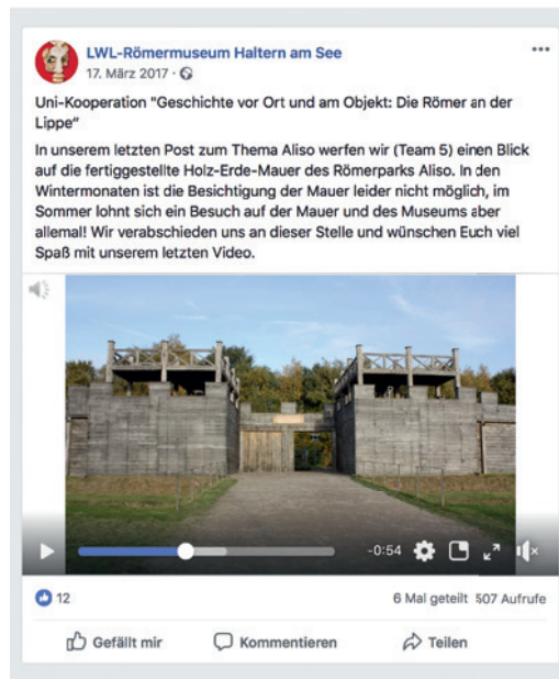
Abb. 5 Ein weiterer Facebook-Beitrag zeigt in einer mit Ton unterlegten Foto- und Videoaufzeichnung die Rekonstruktion des Westtores (Grafik: LWL-Römermuseum).

Den Studierenden ist es im Rahmen der Kooperation eindrucksvoll gelungen, komplexe Sachverhalte präzise, verständlich, visuell ansprechend und auch fachlich korrekt darzustellen. Dabei kamen ihnen sowohl ihre universitären Vorkenntnisse in der Themenbearbeitung als auch ihre Kompetenzen im Umgang mit digitalen Programmen und sozialen Netzwerken zugute.