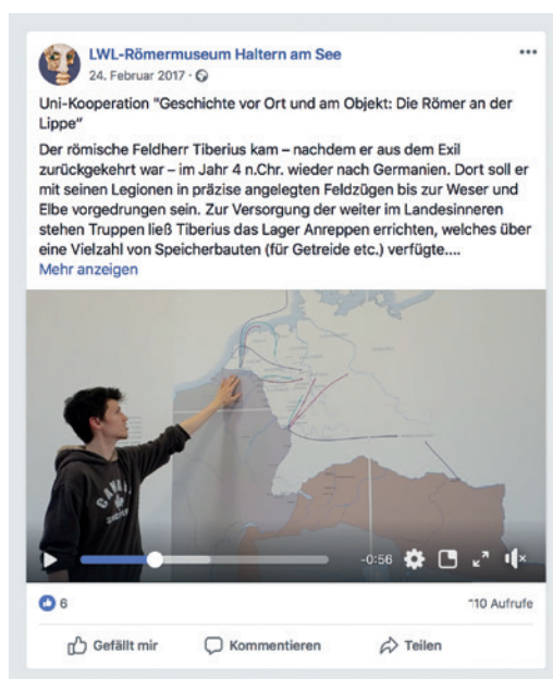
Abb. 2 Ein Studierender erläutert in diesem Facebook-Beitrag an einer Wandkarte im LWL-Römermuseum die römischen Feldzüge (Grafik: LWL-Römermuseum).

Auch Interviews wurden filmisch dokumentiert. So stellte sich Bettina Tremmel vom Provinzialrömischen Referat der LWL-Archäo-