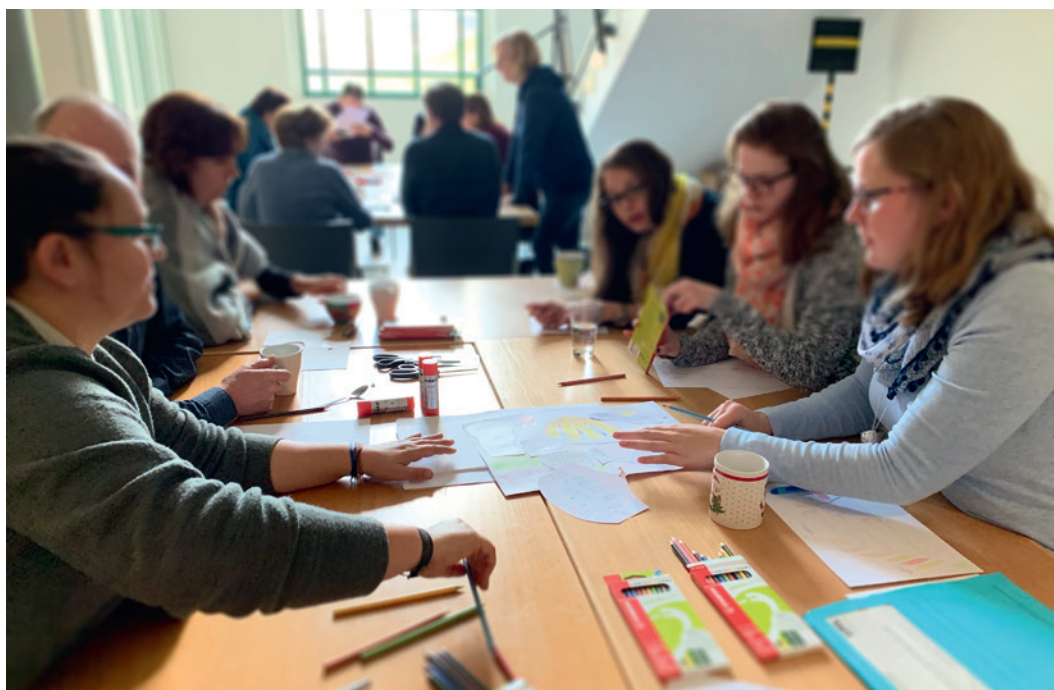
Abb. 4 Zusammenfassung der einzelnen Ideen zu einer Gruppenidee.

Beispielhaft kann das Thema Digitalisierung angeführt werden. Seit ungefähr zwei Jahrzehnten ringen Befürworter und Skeptiker um die Bedeutung der Digitalisierung für Museen und andere Kultureinrichtungen. Von Banalisierung ist hier ebenso die Rede wie von der Aufwertung des Originals im Angesicht des digitalen Abbilds. Doch wenn Museen plötzlich schließen müssen, wie aktuell in der Corona-Pandemie, ist das Digitale der einzige Zugang zur Kultur und jene Einrichtung im Vorteil, die sich bereits mit dem Thema nicht nur theoretisch, sondern praktisch auseinandergesetzt hat. Was das LWL-Museum für Archäologie in diesem Fall zu bieten hatte, ist Thema des nächsten Heftes – so viel sei schon einmal verraten.