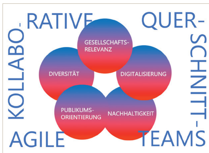
Abb. 5 Fünf Faktoren, die in Zukunft die Arbeit am LWL-Museum für Archäologie beeinflussen. In den zugehörigen agilen und kollaborativen Querschnittsteams werden Maßnahmen zur Umsetzung der Themen erarbeitet (Grafik: LWL-Museum für Archäologie/D. Mölders).

Beispielhaft kann das Thema Digitalisierung angeführt werden. Seit ungefähr zwei Jahrzehnten ringen Befürworter und Skeptiker um die Bedeutung der Digitalisierung für Museen und andere Kultureinrichtungen. Von Banalisierung ist hier ebenso die Rede wie von der Aufwertung des Originals im Angesicht des digitalen Abbilds. Doch wenn Museen plötzlich schließen müssen, wie aktuell in der Corona-Pandemie, ist das Digitale der einzige Zugang zur Kultur und jene Einrichtung im Vorteil, die sich bereits mit dem Thema nicht nur theoretisch, sondern praktisch auseinandergesetzt hat. Was das LWL-Museum für Archäologie in diesem Fall zu bieten hatte, ist Thema des nächsten Heftes – so viel sei schon einmal verraten.