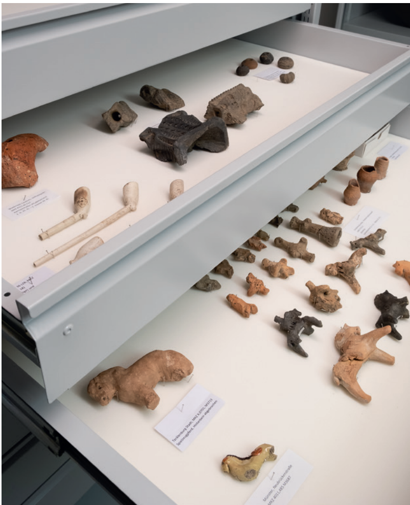
Abb. 1 Die Schauschubladen mit Kleinobjekten.

Da das Archivieren von Funden in geschlossenen Kartons, die das Potenzial zur Präsentation besitzen, schlichtweg zu schade ist, ist nun ein weiterer Schauraum für die quantitativ größte Fundgruppe der Archäologie hinzugekommen – ein Schauraum für Keramik. Er befindet sich in der dritten Etage des Zentralen Fundarchivs.