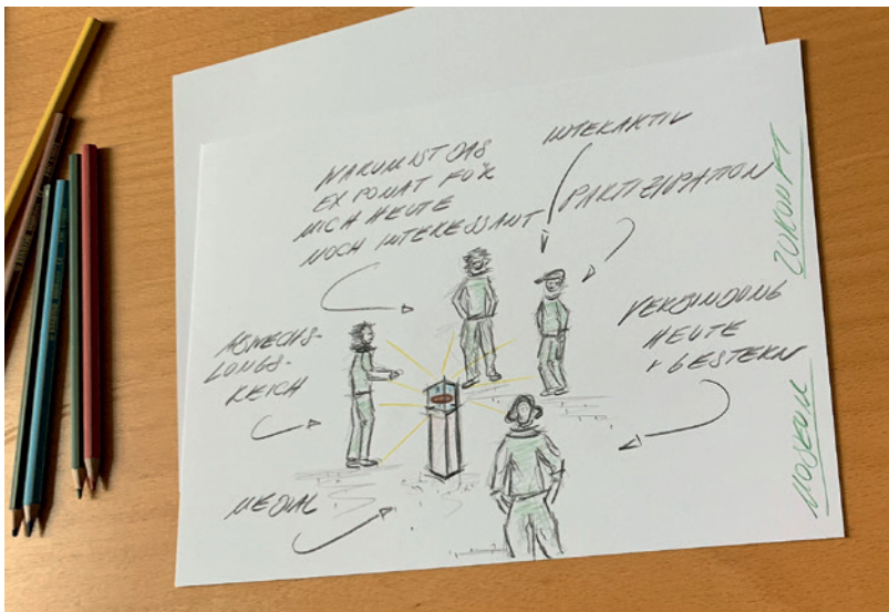
Abb. 3 Vorstellung der Einzelideen für die Zukunft des LWL-Museums für Archäologie.