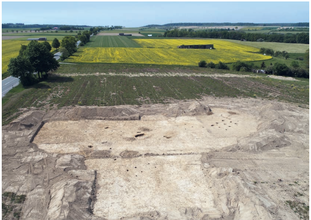
Abb. 2 Drohnenluftbild mit Blick nach Westen über die westliche Hofstelle.

tenbauten aus der gut 8 km nordöstlich gelegenen Wüstung Bodene. Auch dort konnte kaum ertragreiche Landwirtschaft betrieben werden.