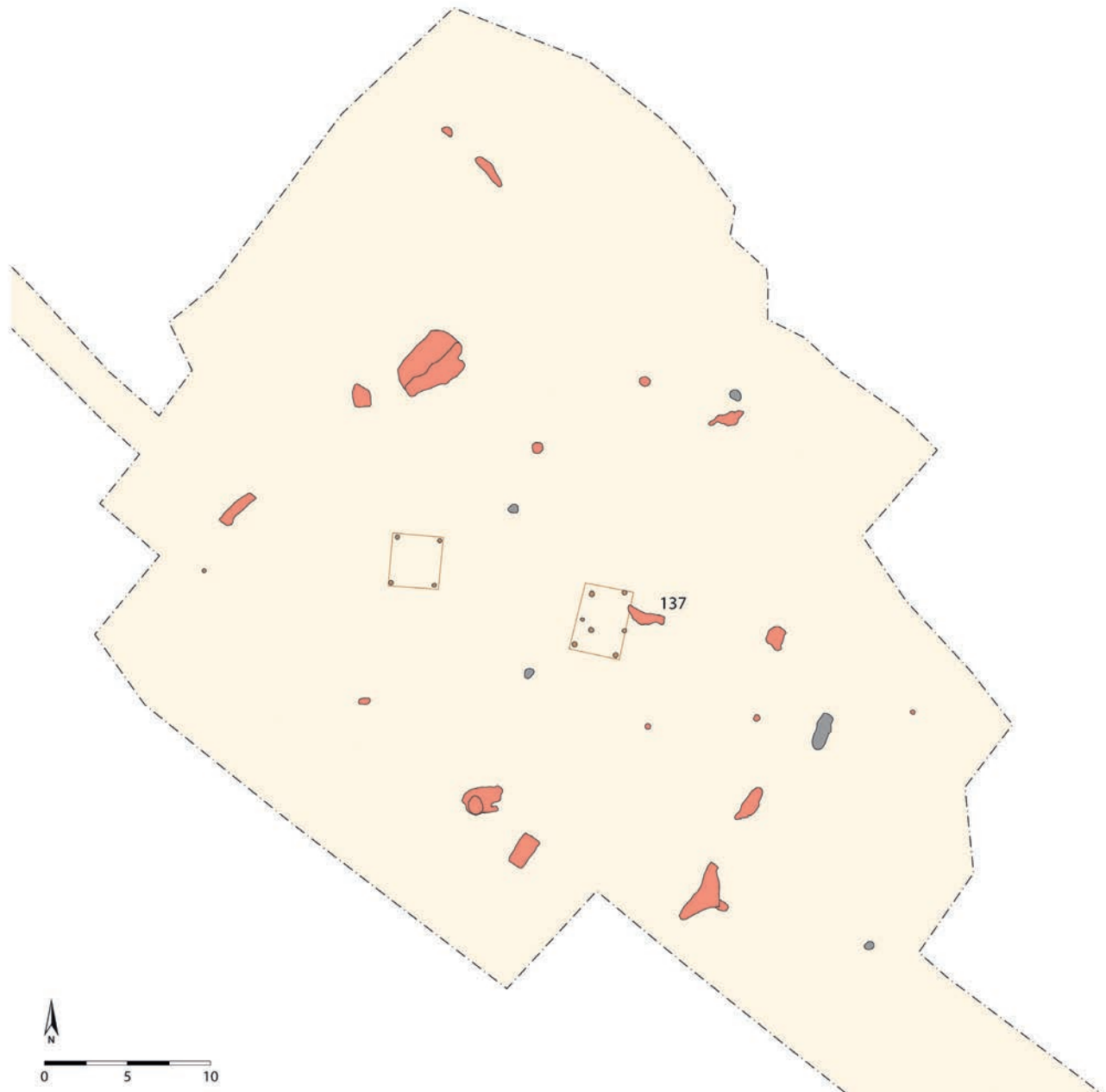
Abb. 4 Grabungsplan der östlichen Hofstelle mit kleinem Gebäude und Vier-Pfosten-Speicher (Grafik: Goldschmidt Archäologie & Denkmalpflege und LWL-Archäologie für Westfalen/ C. Hildebrand).

bei den seit der Bronzezeit belegten Grabhügelfeldern während dieser Zeit dort nicht mehr bestattet worden ist, worin sich ein weiterer Bruch mit den Traditionen andeutet.