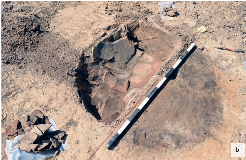
Abb. 2 Grube 91 während der Profilanlage. a: An der linken Seite ist die mit den Scherben des großen Gefäßes ausgekleidete Grubenwand erkennbar, in der Mitte eingefallene Topfreste und ein Spinnwirtel. b: Im Zentrum von Grube 91 befand sich ein flaches, pfannenartiges Gefäßfragment.

großes Vorratsgefäß (Rautopf) eingesetzt worden, das ursprünglich wohl die gesamte Grube ausfüllte. Im Zentrum der Grube befand sich unter den eingebrochenen Resten dieses Gefäßes ein großes, flaches Gefäßfragment, das