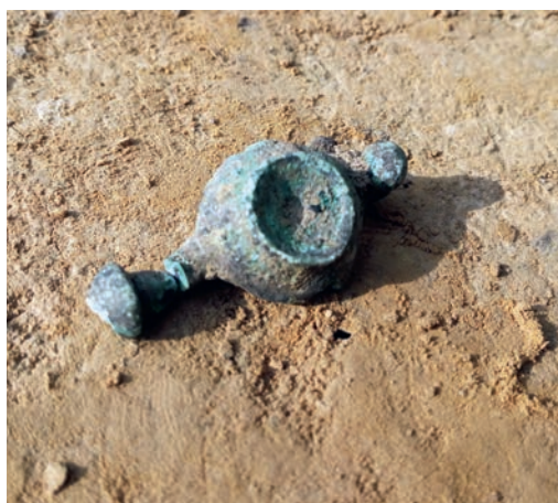
Abb. 4 Die eisenzeitliche Paukenfibel aus Grube 98.

Aus Schichtbefund 65 stammt eine ungewöhnliche Millefiori-Perle (Abb. 5), die beim