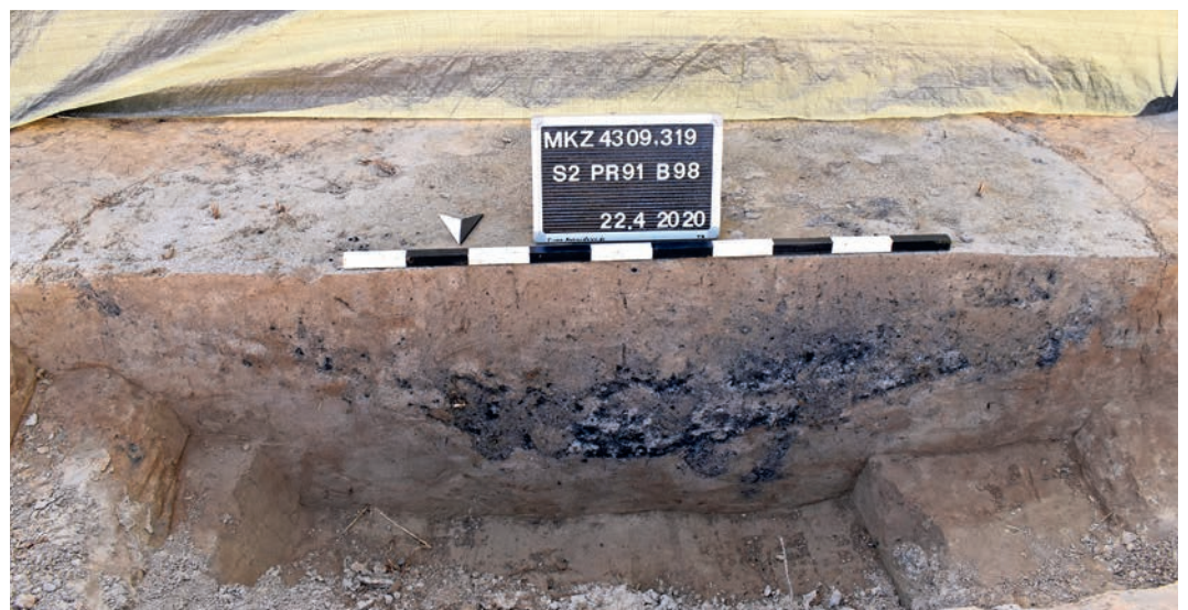
Abb. 3 Grube 98 in der Profilansicht. Aus dem unteren, dunklen Sohlenbereich stammt die bronzene Paukenfibel.

Der bedeutendste Fund dieser Siedlung stammt aus Befund 98 (Abb. 3). Bei dem Befund handelt es sich um eine 1,69 m × 1,89 m große, rundliche Grube, die mehrschichtig verfüllt wurde. Der untere Bereich an der Sohle wies große Mengen an Holzkohle auf. Eine bronzene Fibel (Abb. 4), die gleichzeitig der einzige Buntmetallfund der Siedlungsstelle ist, wurde mittig, kurz über der Sohle, in einer starken Holzkohleschicht geborgen. Es hat den Anschein, dass sie absichtlich am Boden der Grube platziert wurde. Bei der Fibel handelt es sich um eine in dieser Region sehr seltene Paukenfibel mit doppelter, zwiebelkopfförmiger Fußzier. Die Fibel ist nicht vollständig erhalten, es fehlen der Fuß mit Armbrustspiralstruktur, die Nadel und der Nadelhalter. Die Pauke ist kreisförmig eingedrückt und an der oberen Kante durch eine Profilierung ab-