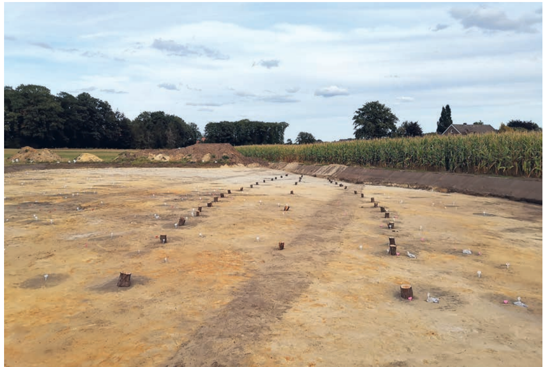
Abb. 3 Schiffsförmiger Hausgrundriss des mittleren Hofes. Die Holzklotze zeigen die ursprünglichen Pfostenstandorte an.

he angelegt. Die Eingänge deuten sich etwas östlich der Hausmitte an den Langseiten an. Im Innenraum weist eine unregelmäßige Reihe schwacher Mittelpfosten auf eine zusätzliche Stützkonstruktion der Decke hin, aber nicht auf eine durchgehende Zweischiffigkeit des Gebäudes. Zwei weitere Pfosten begrenzen einen Raum im Ostteil des Hauses. Die Bauweise des Hauses deutet auf eine Zeitstellung im 9. Jahrhundert hin. Dieser zeitliche Ansatz passt zur ersten Einschätzung der Keramikfunde, die eine Datierung nach etwa 820/830 wahrscheinlich macht. Im Westteil des Hofes liegt ein Nebengebäude mit einer abweichenden Ausrichtung. Hier deuten erneuerte Hauspfosten eine längere Lebensdauer des Gebäudes an. Ein etwas nördlicher gelegener Pfostenhausgrundriss überlagert den ersten