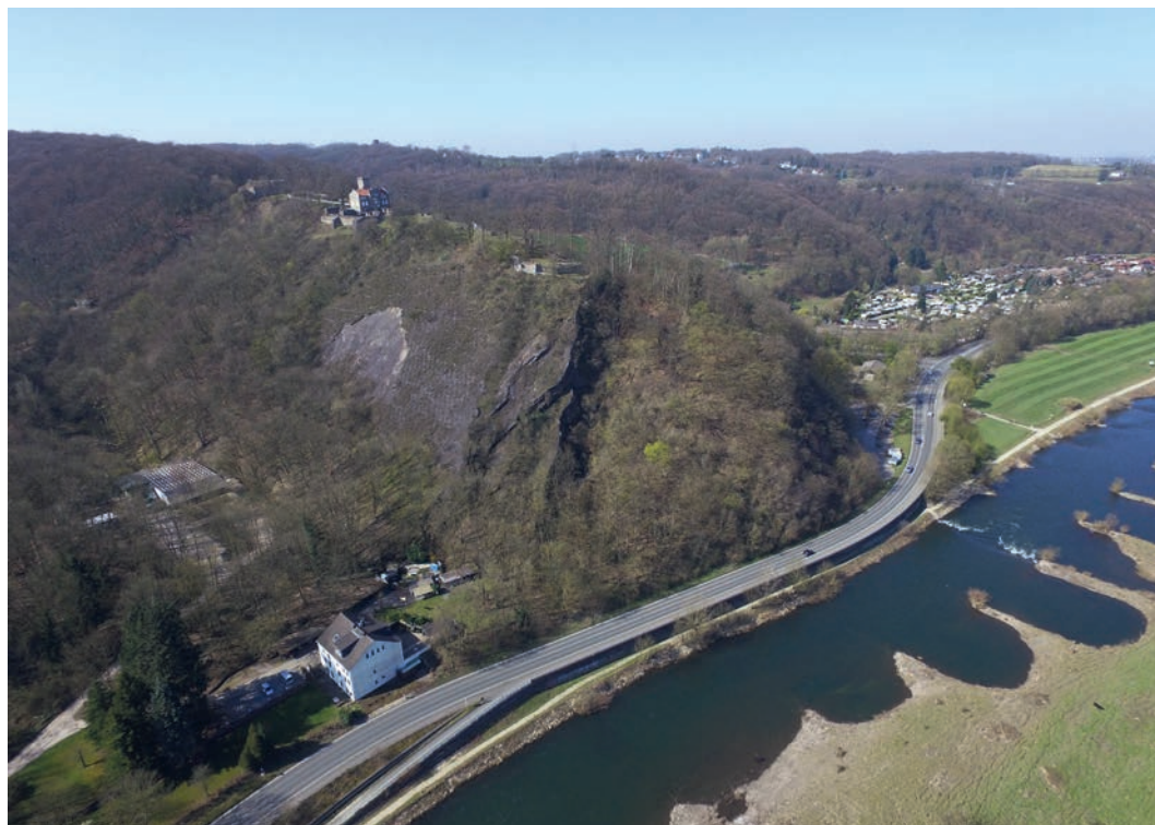
Abb. 1 Luftbild der Isenburg von Osten. Deutlich erkennbar sind die Spornanlage der Burg über der Ruhr mit dem aus dem 19. Jahrhundert stammenden Haus Custodis sowie die durch den Steinbruch bewirkten Schäden an der südlichen Bergflanke.

Die Geschichte dieser hinterhältigen Tat, die uns Lampert von Hersfeld in seinen Annalen für das Jahr 1076 überliefert, ging den Archäologen des Fachreferats Mittelalter- und Neuzeitarchäologie der LWL-Archäologie für Westfalen durch den Kopf, als sie sich im Frühjahr 2020 mit einer Latrinenanlage auf der Isenburg beschäftigten.