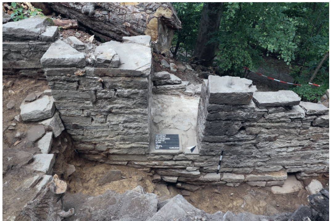
Abb. 4 Sorgfältig bearbeitetes Mauerwerk des Aufgehenden über dem Ablaufkanal im Fundamentbereich (Foto: LWL-Archäologie für Westfalen/W. Essling-Wintzer).

Zurück zu dem eingangs zitierten Vorfall, dessen Tatort und genaue Umstände sich auf Grundlage von Lamperts Erzählung allerdings nur schwerlich erschließen lassen, fällt im Zusammenhang mit dem nun untersuchten Abtritt Folgendes auf: Die Auslässe der zugehörigen Entsorgungsschächte liegen auf einem Niveau, das ohne größere Schwierigkeiten von