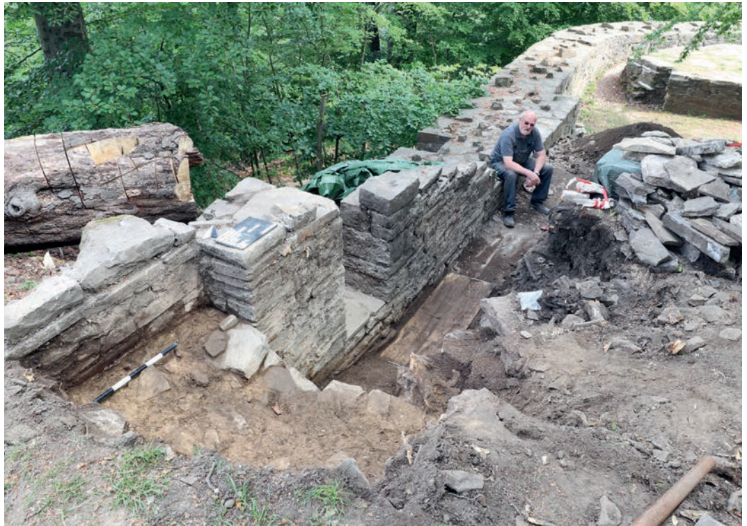
Abb. 2 Blick von Süden auf das neu freigelegte Ringmauerstück. Links im Bild die gefällte Buche.

Die Isenburg (Burg Isenberg) liegt ca. 5 km südwestlich der Stadt Hattingen auf dem Sporn des sich ca. 80 m über die Ruhr erhebenden Isenberges (Abb. 1). Sie besteht aus einer jeweils 120 m langen Unter- und Oberburg und weist eine umbaute Fläche von etwa 9300 m 2 auf. Die Grafen von Altena haben um 1193/1194 mit dem Bau begonnen, zerstört wurde sie im Winter 1225/1226 nach einem Konflikt, der für den Erzbischof von Köln tödlich endete. Weitere Zerstörungen entstanden durch einen Steinbruchbetrieb im 19./20. Jahrhundert, dem fast die gesamte Südostseite der Burg zum Opfer fiel. Die nicht wieder überbauten Ruinenreste wurden 1969–1989 von einer archäologischen Schülerarbeitsgemeinschaft freigelegt. Dabei konnten im nordwestlichen Ringmauerabschnitt zehn Entsorgungsschächte festgestellt und durch Aufmauerungen gesichert werden. Erst 1974 gelang es, einen dieser Schächte am Ende eines Mauergangs funktional einer Abtrittanlage zuzuordnen. Die hier interessierende Abtrittanlage in der westlichen Ringmauer der Unterburg war seit Jahren bekannt und zeichnete sich auf der Außenseite des zerstörten Ringmauerwerks ab. Innenseitig verhinderte eine ca. 120 Jahre alte Buche, die nun als Gefahrenbaum gefällt werden musste, weitere Untersuchungen (Abb. 2). Da die vertrocknenden Wurzelstränge die umschlossenen Mauerreste zunehmend freigaben und sich Materialver-