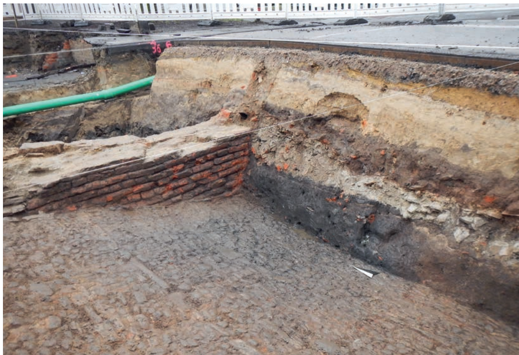
Abb. 1 Pflasterweg im mittleren Bereich des Liebfrauentores. Die Geschützkugel stammt aus der Schuttschicht in dem Profil.

kunde zur wissenschaftlichen Bearbeitung ins Museum holten. Sie lag in einer stark schutthaltigen Schicht, die sich oberhalb eines steil abfallenden Pflasterweges im mittleren Torbereich befand. Die Kugel stammt sehr wahrscheinlich aus der Zeit der Belagerung der Täufer in Münster 1534–1535, durch Fürstbischof Franz von Waldeck.