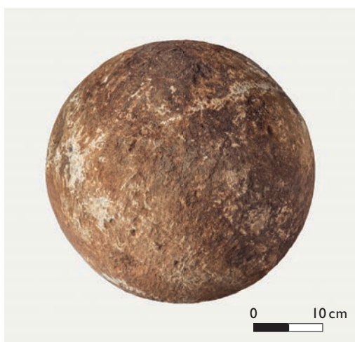
Abb. 2 Weitgehend unbeschädigte Hälfte der Kugel (Foto: LWL-Museum für Naturkunde/C. Steinweg).

Die Geschichte der Kugel beginnt jedoch viel früher: im oberen Obercampanium (ca. 76 Millionen Jahre), der zweitjüngsten Stufe der Kreidezeit. In diesem Zeitabschnitt hatte sich im Zuge der Inversion des Niedersächsischen Beckens im Münsterland ein flacheres Meer gebildet, dass in zahlreiche kleinräumige Becken- und Schwellengebiete gegliedert war. Schwellengebiete lagen u. a. westlich und nordwestlich der heutigen Baumberge und im Raum Winterswijk/Ostniederlande. Im Raum Havixbeck, Billerbeck, Nottuln befand sich