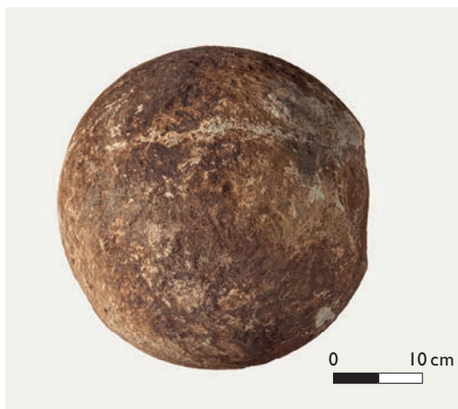
Abb. 4 Glatte Auflagefläche an der Kugel (rechts) und Mörtelreste.

ein Becken, in dem die Baumberge Formation, das jüngste kreidezeitliche Schichtglied des Münsterlandes, abgelagert wurde. Diese Formation wird lithostratigrafisch in die unteren und die oberen Baumberger Schichten untergliedert. Die Schichtenfolge beginnt mit dem Billerbecker Grünsand, einem hellgelbgrauen feinsandigen Kalkmergelstein, der viel Glaukonit enthält (Abb. 5). In großen Bereichen