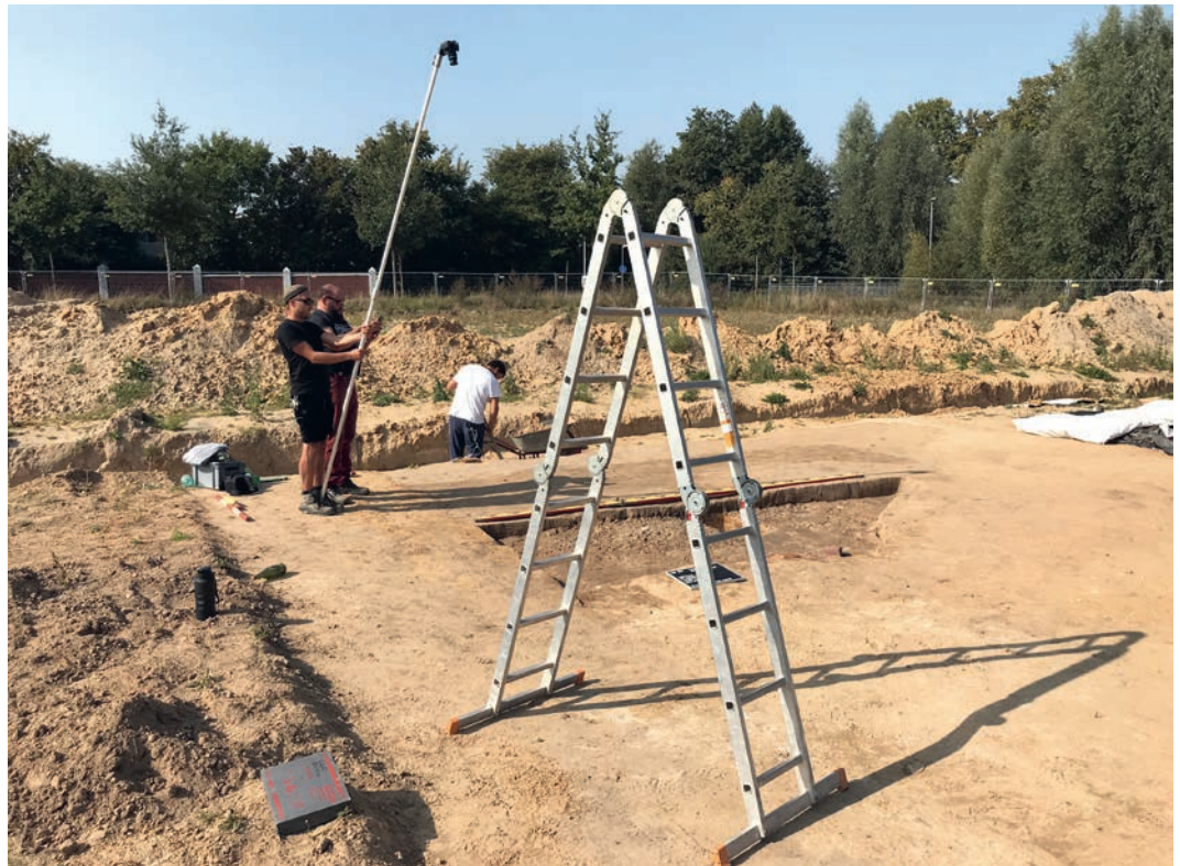
Abb. 1 Nach dem Abziehen des Ober- und Mischbodens war die ehemals etwa 0,8 m tiefe Baugrube der Baracke nur noch 15–20 cm tief erhalten.

schnell auf anfliegende Bomberpulks reagieren können sollten. Dadurch wurde der Fliegerhorst Handorf wiederum zum Ziel von alliierten Jagdbombern, die versuchten, die deutschen Jagdmaschinen bereits am Boden zu zerstören. Als Reaktion darauf wurden verstärkt Stellungen für leichte und mittlere Flugabwehrwaffen errichtet, die zur Bekämpfung von Tieffliegern vorgesehen waren. Teil dieses Schutzgürtels um den Flughafen herum war auch die von der Stadtarchäologie Münster untersuchte Flugabwehr-Stellung »p« (Fla-Stellung) (Abb. 1).