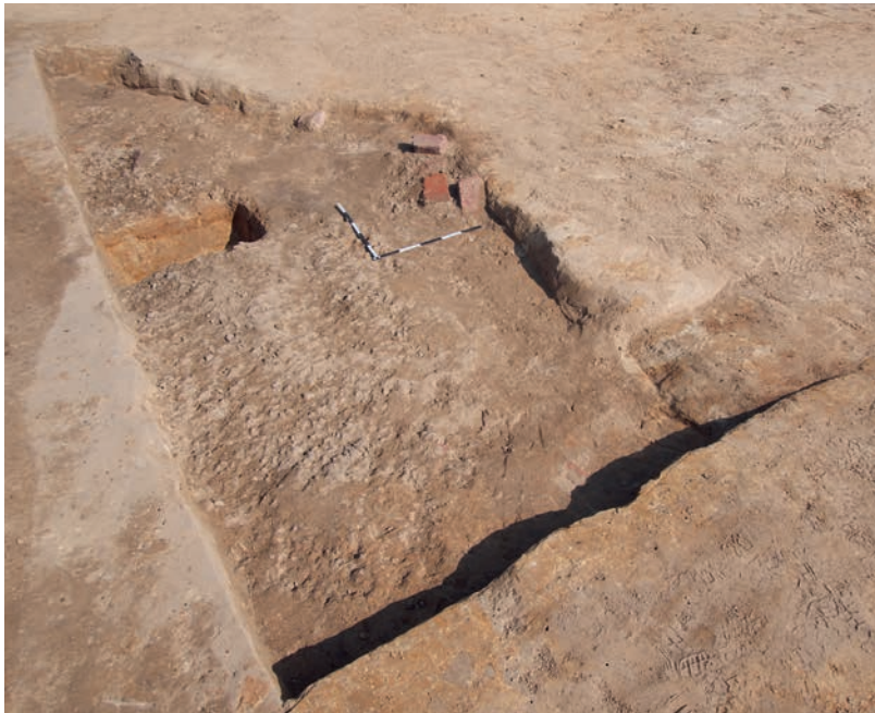
Abb. 3 Blick in die Barackengrube mit Schotterbett. Die verlagerten Ziegelsteine gehören zur Substruktion des Holzgebäudes. Der nicht geschotterte Freibereich ist oben zu erkennen, während rechts eine Nische unbekanntes Zwecks freigelegt wurde (Foto: Stadtarchäologie Münster/J. Müller-Kissing).

tet worden. Diese divergierende Konstruktion zeigt, mit wie unterschiedlichen Bauausführungen selbst auf kleinstem Raum zu rechnen ist.