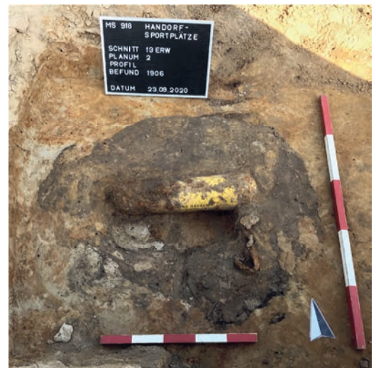
Abb. 4 Befundsituation mit der teilweise freigelegten Atemluftflasche in Grube 1906. Die Erkennungszeichen waren durch den restlichen Abfall weiter nach unten auf die Sohle der Grube gewandert.

Neben diesem eindrücklichen Befund eines Einzelschicksals bot der restliche Inhalt der Gruben Einblicke in den Alltag der deutschen Soldaten. Auffällig war die große Anzahl von Hygieneartikeln für Männer fortgeschrittenen Alters, wie Haartonika von einer unbekanntes Firma aus Düsseldorf sowie von Wolff & Sohn aus Karlsruhe, aber auch Tablettenröhrchen und Salbe zur Behandlung von Hornhaut. Die Funde decken sich nur bedingt mit den Informationen zu den Besetzungen leichter Fla-Stellungen, da diese üblicherweise eher aus Jugendlichen bestehen sollten. Einzelne erfahrene und für den Fronteinsatz zu alte Soldaten sollten dabei die Leitung übernehmen. Die Menge der Pflegeprodukte spricht aber dafür, dass überdurchschnittlich viele ältere Männer hier stationiert waren. Ob die großen Men-