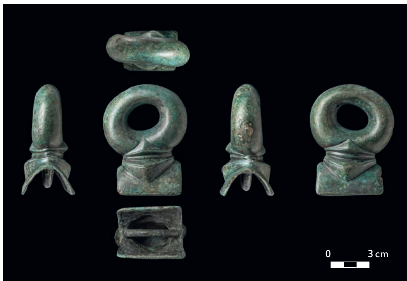
Abb. 1 Bronzener Führungsring vom Weilenscheid bei Lennestadt-Elspe.

Das Weilenscheider Stück ist plastisch profiliert und weist als formales Charakteristikum zum einen eine langrechteckige, u-förmig gebogene Befestigungsplatte und zum anderen einen verzierten Befestigungswulst auf, der