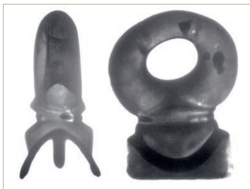
Abb. 4 Röntgenaufnahme des Führungsringes in der Vorder- und Seitenansicht. Erkennbar sind drei Löcher für die vermuteten Haltestifte, eine Reparatur einer Fehlstelle mit einem nagelförmigen Keil und die Gussfahnen von Rissen und Hohlräumen in der Lehmform im Inneren des hohlen Rings.

sen (Abb. 4). Haltestifte dienen der Fixierung von Tonkernen in der Tonummantelung bei geschlossenen Hohlgrüssen, wenn das Wachs ausgeschmolzen wird (Abb. 3, 5). Eigentlich erscheinen sie in diesem Fall nicht notwendig, da der Übergang vom Ring zum unteren Teil unten offen ist und dadurch Tonkern und äußere Tonschicht miteinander verbunden sind, womit auch der Halt in der Gesamtform gegeben ist. Möglicherweise befürchtete man aber, dass der Tonkernring im Bereich der profilierten Zierzone, hier ist die Verbindung am geringsten, durch Schwund beim Trocknen abreißen