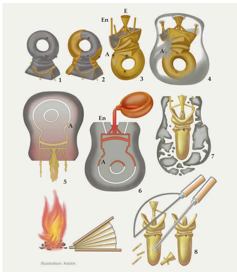
Abb. 3 Arbeitsschritte für die Herstellung des Hohl-gussobjektes. Grau: Tonmodell; orange: Wachsschicht; rot: flüssige Bronze; gelb: gegossenes Bronzeobjekt (Grafik: LWL-Archäologie für Westfalen/A. Müller).

ne und die u-förmige Befestigungsplatte als Tonkern modelliert. Dieser wurde dann mit einer dünnen Wachsschicht belegt und anschließend mit Ton ummantelt (Abb. 3, 4). Wie eigentlich nur bei geschlossenen Hohlgüssen üblich, hat man anscheinend an drei Stellen Halte-