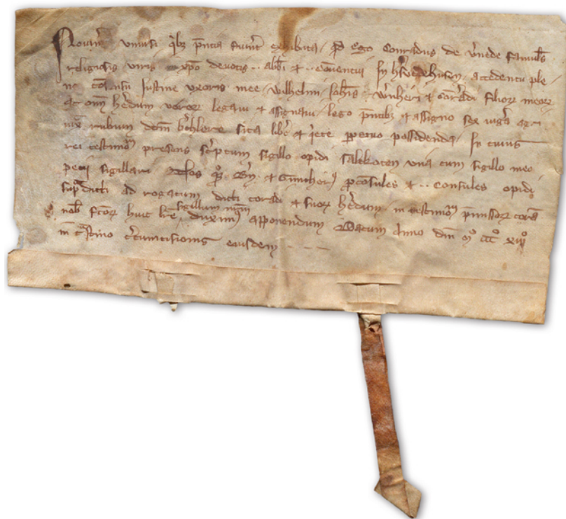
Abb. 4 Eine 1313 ausgestellte Urkunde über den Verkauf von Ländereien bei Salzkotten ist das einzige noch erhaltene Dokument, das nachweislich von Conrad von Vernede besiegelt wurde (Foto: LAV NRW W, B 604u/Kloster Hardehausen – Urkunden Nr. 434).