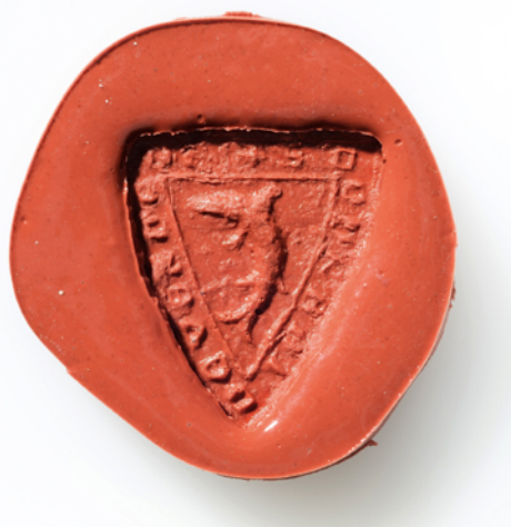
Abb. 5 Der Abdruck des Typars von Salzkotten zeigt die Siegeldarstellung, wie sie dem Urkundenbetrachter begegnete.