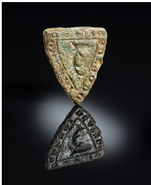
Abb. 2 Das Typar lässt sich anhand der Umschrift und des Wappenbildes – ein gekrümmter Fisch – eindeutig der ministerialischen Familie von Vernede zuordnen (Foto: LWL-Archäologie für Westfalen/S. Brentführer).

des Siegelstempels war, wenngleich einzelne Urkunden im Kontext der Bürgerschaft von Lippstadt und Geseke sowie des Klosters Böddecken irritieren. So erscheint der Name des späteren Ritters urkundlich erstmals 1286 in Geseke und elf Jahre später in Lippstadt, jeweils in der Zeugenreihe an hinterer Position, wo eher Bürger als Ritter und Knappen platziert werden. Dennoch gibt es gute Gründe anzunehmen, dass beide Zeugen und der spätere Ritter identisch sind. Zunächst einmal ist die zeit- und ortsnahe Existenz von drei oder mehr Personen unterschiedlicher familiärer Herkunft mit gleichem Namen sehr unwahrscheinlich. Ferner deckt sich der Aktions- und Besitzradius derer von Vernede mit einem der Orte, in denen die Urkunden ausgestellt wurden: Geseke. Für Lippstadt kann dieses Argument nicht herangezogen werden. Hier lohnt sich stattdessen ein Blick auf die übrigen Namen in den Zeugenreihen und damit auf die schriftliche Gesamtkonstellation der Anwesenden. Conrad von Vernede wird zwischen den Rittern und den Bürgern Lippstadts ( oppidanis nostris Lippensibus ) geführt. Gleiches gilt für die Brüder Friedrich und Everhard Boleke, deren Namen unmittelbar auf Conrad folgen. Beide erscheinen wenige Jahre später selbst im Kreis des Niederadels: Everhard 1300 als Ritter, Friedrich 1302 als Knappe. Conrad befand sich in Lippstadt also in bester Gesellschaft und stammte daher wohl