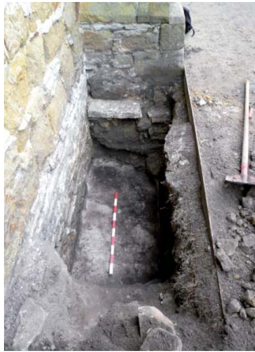
Abb. 3 Befund vor dem nördlichsten Strebebepfeiler der Westwand des Klosterostflügels von Norden: unten Fundament und Aufgehendes der Phase 1 aus Kalkbruchsteinschollen, darüber Mauerwerk mit Sandsteinblöcken der Phase 2, zu der auch das vorgesetzte Strebebepfeilermauerwerk gehört (Foto: LWL-Archäologie für Westfalen/O. Ellger).

Eine abschließende Interpretation der Befunde ist bei den bisher begrenzten Einblicken nicht möglich. Glaubwürdig erscheint die Überlieferung, die Fläche nördlich der Kirche sei erst im Spätmittelalter zum Klosterstandort geworden. Das Gelände dort lag tief und war ursprünglich offenbar feucht. Erst durch umfangreiche Auffüllungen in Zeiten, als es schon Stein- und abgebrannte Fachwerkgebäude in der Umgebung gab, wurde es als Klostergelände nutzbar. Am wahrscheinlichsten entstammen alle gefundenen Spuren des Nord- und des Ostflügels einem mehrphasigen Bauprozess des ausgehenden 15. Jahrhunderts. Dem Klosterbau der Oderadis am Anfang des 14. Jahrhunderts könnten dann das offenbar auf höherem Grund errichtete Fachwerkgebäude unter dem südöstlichen Ostflügel, eventuell ein Gebäude über der »grabfreien Zone« und vielleicht auch der locker belegte Friedhof zugerechnet werden. Denkbar bleibt aber bisher auch eine Zuordnung des Nordflügels – vielleicht auch der unteren Kreuzgangmauern im Ostflügel – in die Zeit der Oderadis, dann wären die vorher genannten Befunde entsprechend älter. Noch bleiben in Herzebrock viele Fragen offen. Aber die beschriebenen Ergebnisse zeigen, dass auch kleine Bodeneingriffe die Archäologie voranbringen können, wenn eine kontinuierliche Beobachtung gesichert ist.