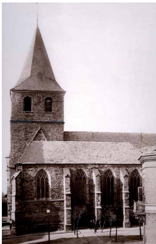
Abb. 1 Die Kirche kurz vor dem Abriss 1890.

Im Verlauf des Jahres 2010 soll der Kirchplatz im Zuge einer Innenstadtaufwertung umgestaltet werden, weshalb im Sommer 2009 in dem Bereich, in dem die Reste des Vorgängerbaus lagen, archäologische Grabungen not-