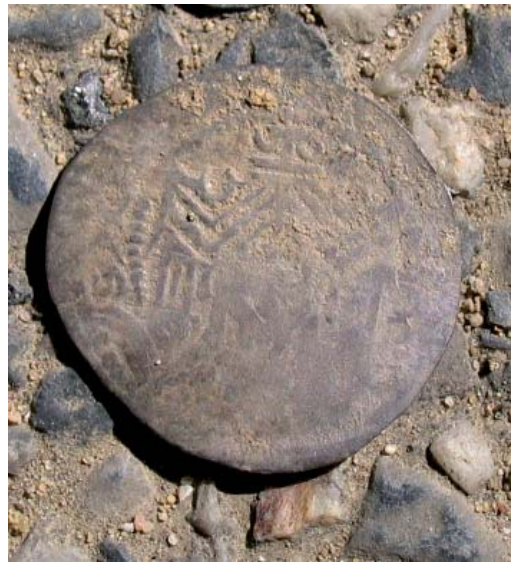
Abb. 3 Erzbischöflich-kölnischer Pfennig von Siegfried von Westerbürg von 1275 bis 1282 (Foto: LWL-Archäologie für Westfalen/K. Bulka).

Außerhalb der Kirche wurden 15 Bestattungen freigelegt, die bis auf zwei Ausnahmen West-Ost-ausgerichtet waren. Eine der beiden abweichenden Bestattungen orientierte sich an einem der Strebepfeiler und wies eine Nord-Süd-Ausrichtung auf, sodass angenommen werden kann, dass hier die Nähe zur Kirche gegenüber der vorgegebenen christlichen Orientierung bevorzugt wurde. Die zweite Bestattung war Ost-West-orientiert, wobei ein Grund für diese Abweichung wäh-