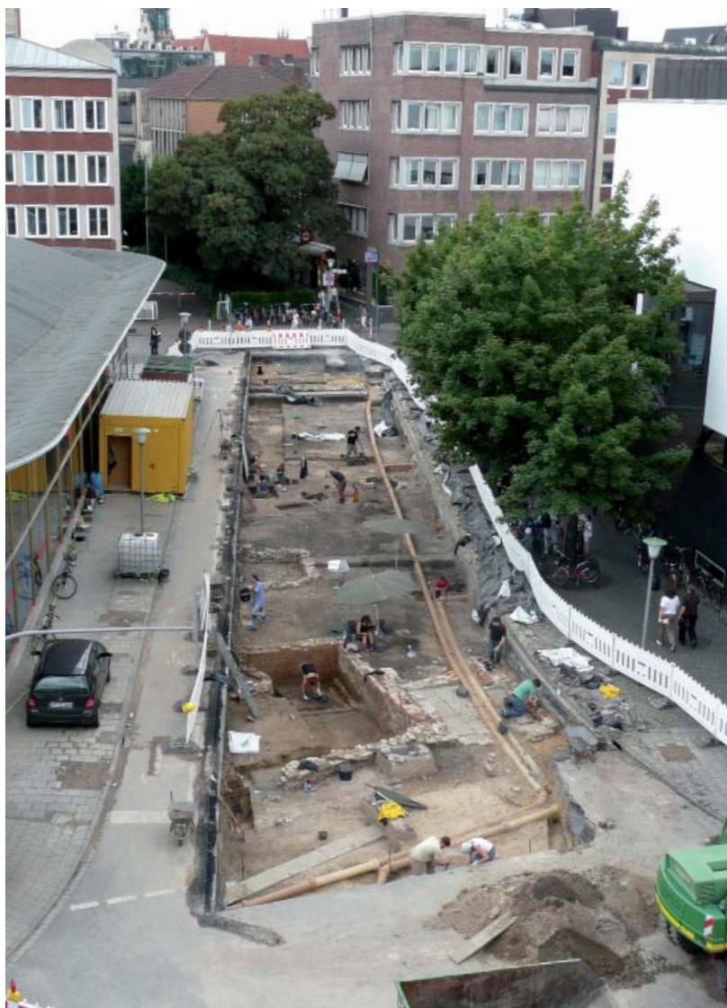
Abb. 1 Blick über die Grabungsfläche.

Das Kartenmaterial weist für das betreffende Areal eine größere Freifläche in der Mitte auf. Während die Vogelschau des Malers Everhard Alerdinck aus dem Jahre 1636 zudem eine Bebauung zum Alten Steinweg hin darstellt, verzeichnet das Urkatasterblatt von 1828 zwei Gebäude an der Mauritzstraße. Der Zustand von 1828 blieb bis zu den Zerstörungen im Zweiten Weltkrieg unverändert. Nach dem Ende des Krieges wurde auf der Parzelle 14 die neue Asche-Straße angelegt und die Straßenführung der Mauritzstraße verändert,