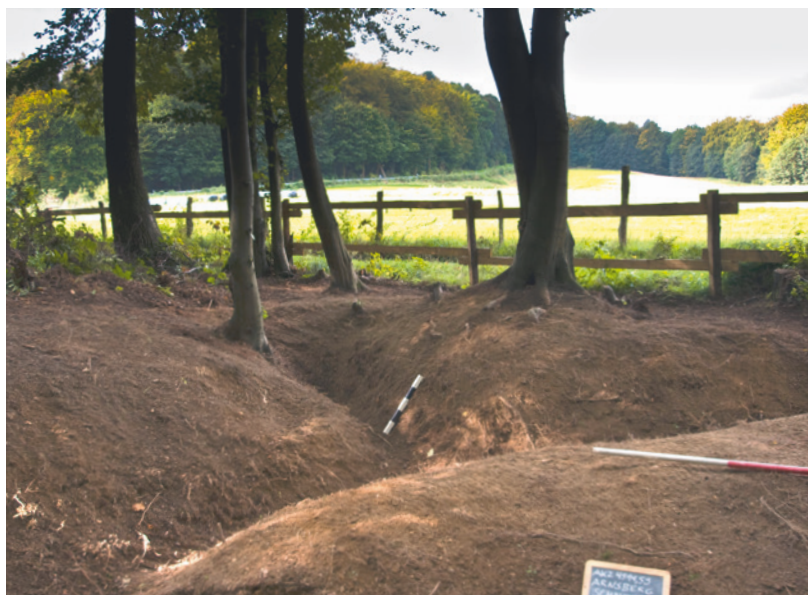
Abb. 5 Schützennischen bzw. Maschinengewehrnes-ter von Kampfgraben I mit Schussfeld im Hintergrund.

reits die Weltkriegsgeschehnisse am Viadukt thematisiert, können die untersuchten Unterstände Anknüpfungspunkt sein, um an die Kriegsergebnisse der Stadt zu erinnern.