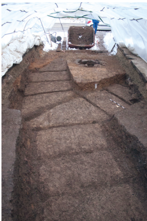
Abb. 4 Ansicht des nordwestlichen Eingangsbereiches im Dezember 2010.