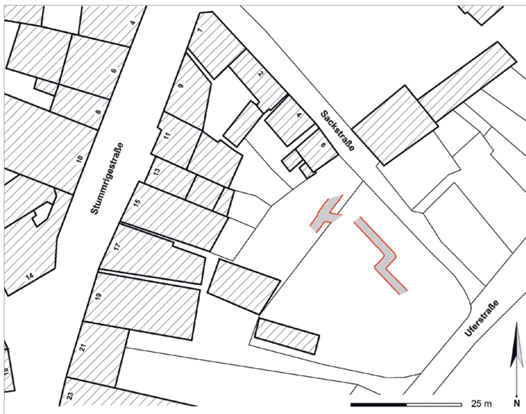
Abb. 1 Lage des Splittergrabens auf dem Grundstück (Grafik: R. Schlottbauer).

gen aus Gussbeton, Fertigbeton- oder Stahlelementen gab, waren jene mit Holzausbau die am schnellsten herzustellenden Schutzanlagen. Auch der Kostenaufwand und das nötige Fachwissen waren hier am geringsten.