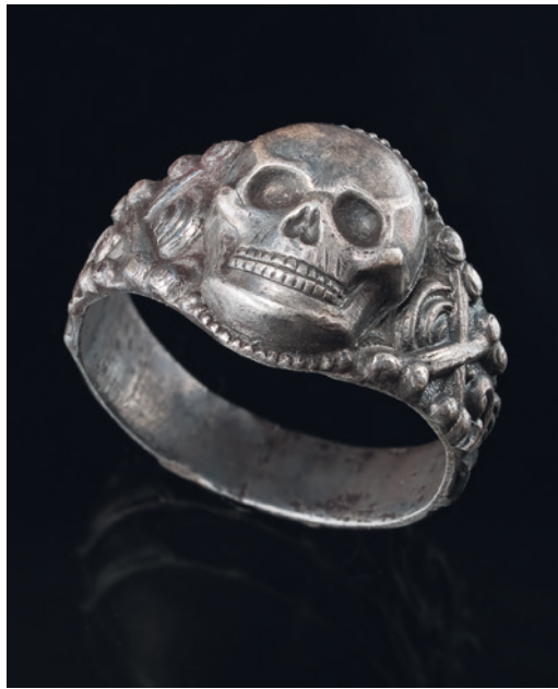
Abb. 5 Totenkopfring aus dem Splittergraben mit floralen Verzierungen und Knochenbündeln. Durchmesser 1,8 cm.

Nur durch die Befragung der Zeitzeugen konnten Details erfasst werden, die ohne ihre Mithilfe nur noch schwer oder gar nicht mehr rekonstruierbar gewesen wären. Auch wenn nur 54 Jahre zwischen dem Abriss und der ersten Grabung liegen, wussten nur die Anwohner von dem Splittergraben, die schon im Krieg in seiner Nähe lebten. Hier zeigt sich, wie wichtig eine zeitnahe Untersuchung derartiger Anlagen ist, um nicht nur auf die rein archäologischen und – wenn vorhanden – archivalischen Quellen angewiesen zu sein. Mit