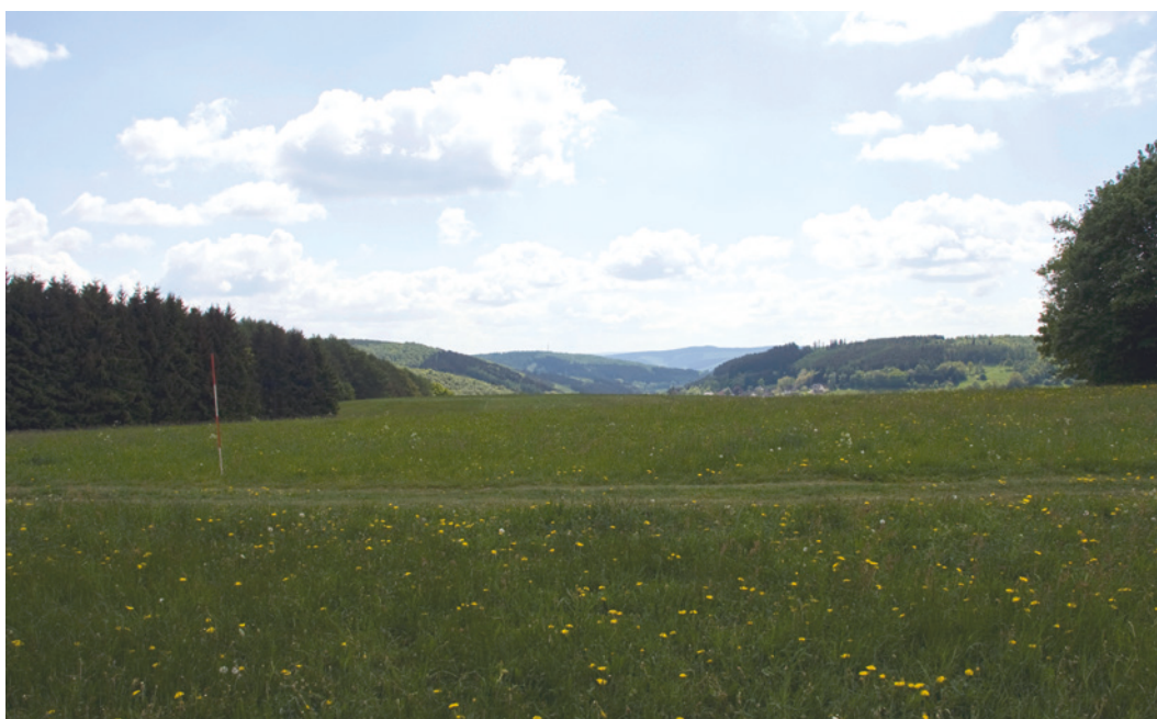
Abb. 1 Teilbereich des Plangebiets Industrie- und Gewerbepark Seelbach, Blick nach Süden.

Darüber hinaus wurden bei weiteren Prospektionen prominente und alt gegrabene Fundstellen der eisenzeitlichen Montanlandschaft erneut begangen oder wieder aufgespürt. Es handelt sich um die ausgedehnten Verhüttungsfundstellen an der Engsbach (Siegen-Achenbach), an der Minnerbach (Siegen-Winchenbach) und an der Leimbach (Wilnsdorf-Obersdorf). Die Überprägung dieser Orte ist insbesondere durch Infrastrukturmaßnahmen seit den 1960er-Jahren sehr massiv. Trotzdem sind alle Produktionsstandorte noch großflächig erhalten und bieten weiterhin großes Forschungspotenzial, da sie nur teilweise gegraben oder nicht auf moderne Fragestellungen hin untersucht wurden. Beispielsweise spülte die Minnerbach mittlerweile nicht ausgegrabene Bereiche einer Schlackenhalde frei. Dabei wurde eine Schicht von verbackenen, metallurgischen Resten erster Schmiede- bzw. Lupenreinigungsprozesse freigelegt (sogenannte Schlackenbreccie). So kann neben dem 2003 bis