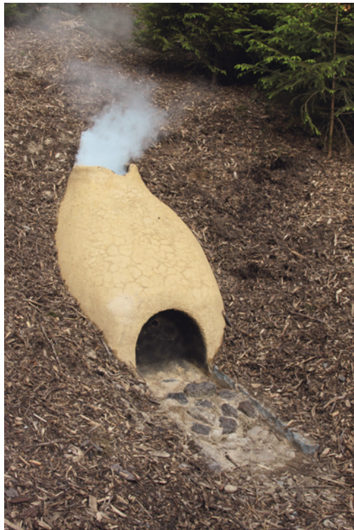
Abb. 4 Rennofenmodell Siegen-Achenbach an der Engsbach (Foto: DBM, RUB/M. Zeiler).

hergestellt werden. Als Vorlage dienten hier vor allem jüngere archäologische Untersuchungen der Bodendenkmalpflege bzw. des Siegerlandprojektes am Trüllesseifen und an der Wartestraße (Siegen-Niederschelden). Die Besonderheit an diesem Modell ist die Überdachung, die sogenannte Gichtbühne, über die der Ofen beschickt wurde. Aus Platzgründen war es nicht möglich, eine vollständige eisenzeitliche Werkstatt mit Röst- und Pochbereich sowie Ausheizplatz museal nachzubilden. Außerdem sind die komplexen Arbeitsschritte während der Verhüttung nicht einfach vermittelbar. Deswegen wurde auf dem Gelände des Historischen Haubergs Offdilln e.V. unter der Leitung von Heinz Hadem 2009 ein Verhüttungsexperiment durchgeführt und unter der Leitung von Matthias Pfetzing (Matoliv CrossMediaAgentur) gefilmt. Der Ofen auf dem Gelände des Freilichtmuseums ist zwar nicht baugleich mit denen der Eisenzeit im Siegerland, weist aber ähnliche Abmessungen auf. Das Experiment in Offdilln hat versucht, die bislang nachgewiesenen, eisenzeitlichen Arbeitsschritte nachzuvollziehen. Deswegen konnten in dem Film die Ofenreise des Experiments sowie alle weiteren prähistorischen Tätigkeiten, vom Rösten bis zur Öffnung des abgekühlten Rennofens, veranschaulicht und zudem der enorme Brennstoffverbrauch thematisiert werden.