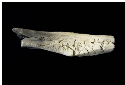
Abb. 5 Fragment der linken Unterkieferhälfte eines tendenziell männlichen, spätmaternen Individuums mit vollständig geschlossenen Zahnfächern nach intravitalem Zahnverlust.

In de vijftiger en zestiger jaren van de vorige eeuw werden in de zandduinen langs de Ems bij Harsewinkel brandgraven uit de ijzertijd ontdekt. Binnen het kader van het interdisciplinaire project »Romeinen en Germanen in Oost-Westfalen-Lippe« is deze vindplaats nu uitgewerkt. De resultaten van dit archeologische en antropologische onderzoek leverden nieuwe kennis op over de leefomstandigheden van de bevolking in de ijzertijd.