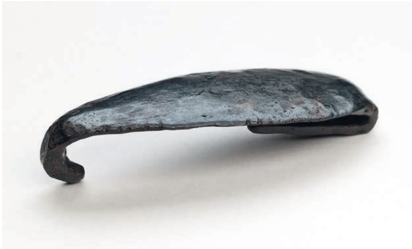
Abb. 4 Eiserner Zungengürtelhaken aus einem Brandschüttungsgrab aus dem 3. Jahrhundert v. Chr. (Foto: LWL-Archäologie für Westfalen/S. Brentführer).

Bei den meisten Gräbern handelte es sich um Einzelbestattungen, lediglich in zwei Fällen wurden zwei Individuen gemeinsam beigesetzt. Bei dem ersten Grab handelt es sich um die Doppelbestattung eines weiblichen, spätadulten Individuums gemeinsam mit einem sechs bis acht Jahre alten Kind, bei dem zweiten um zwei erwachsene Individuen.