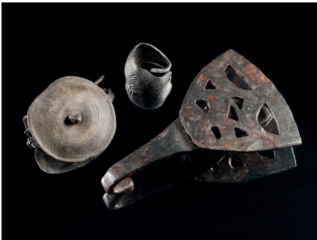
Abb. 2 Verzierter, bronzenener Kahnohrring, eiserner Gürtelhaken mit durchbrochener Deckplatte und Kalottenfibel mit eisernem Nadelhalter und bronzenener Deckplatte aus einem Knochenlager mit dem Leichenbrand eines eher weiblichen, spätadulten Individuums, erste Hälfte 4. Jahrhundert v. Chr..

Bestattungssitte der Oberems-Region während der mittleren und jüngeren vorrömischen Eisenzeit. Ferner sind in geringerem Maße auch Brandgruben vertreten. In drei Fällen wurden bei der Ausgrabung im oberen Bereich der Grabgrube Reste von Holzeinbauten beobachtet, die möglicherweise von oberirdisch sichtbaren Konstruktionen stammen. Aufbau und Funktion können nicht mehr rekonstruiert werden. Als Beigabe ließ sich vor allem Keramik nachweisen. Die Gräber enthielten oft Scherben von bis zu vier unterschiedlichen Beigefäßen, die in den meisten Fällen auf dem Scheiterhaufen mitverbrannt worden sind. Bei den wenigen nachgewiesenen Fragmenten von Tierknochen, die keiner bestimmten Tierart mehr zugewiesen werden konnten, ist unklar, ob es sich um Reste von Speisebeigaben oder um Zufallsfunde handelt. Die für die Region als charakteristisch geltende Beigabenarmut lässt sich für den Fundplatz nicht bestätigen. Insgesamt 37 der 90 untersuchten mittel- bis jüngereisenzeitlichen Gräber enthielten Beigaben aus Metall oder Glas. Oftmals lagen diese jedoch lediglich in Form von Aufschmelzungen auf dem Leichenbrand vor. Unter den identifizierbaren Beigaben überwiegen Fibeln und Fibelbruchstücke, gefolgt von Ohrringen und Gürtelhaken. Nadeln, Armringe, Nägel sowie diverse blaue oder hellgrüne Glasperlen sind eben-