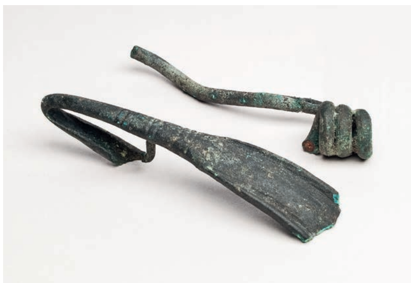
Abb. 3 Eine dem Typ Nauheim ähnliche, bronzene Fibel aus einem Brandgrubengrab mit dem Leichenbrand eines eher weiblichen, frühmaturen Individuums des frühen 1. Jahrhunderts v. Chr. (Foto: LWL-Archäologie für Westfalen/S. Brentführer).

falls überliefert. Beigaben wie Kahnohrringe, ein eiserner Gürtelhaken mit durchbrochener Deckplatte (Abb. 2), Ringgürtelhaken oder eine dem Typ Nauheim sehr ähnliche Fibel (Abb. 3) deuten auf starke Einflüsse aus dem südlich angrenzenden Raum der Latène-Kultur hin. Aber auch Kontakte aus dem nordöstlich und nördlich anschließenden Gebiet der Jastorf-Kultur und der Nienburger Gruppe manifestieren sich bei der Keramik und bei Metallfunden wie einem Segelohrring, einer gekröpften Scheibenkopfnadel und einem Zungengürtelhaken (Abb. 4).