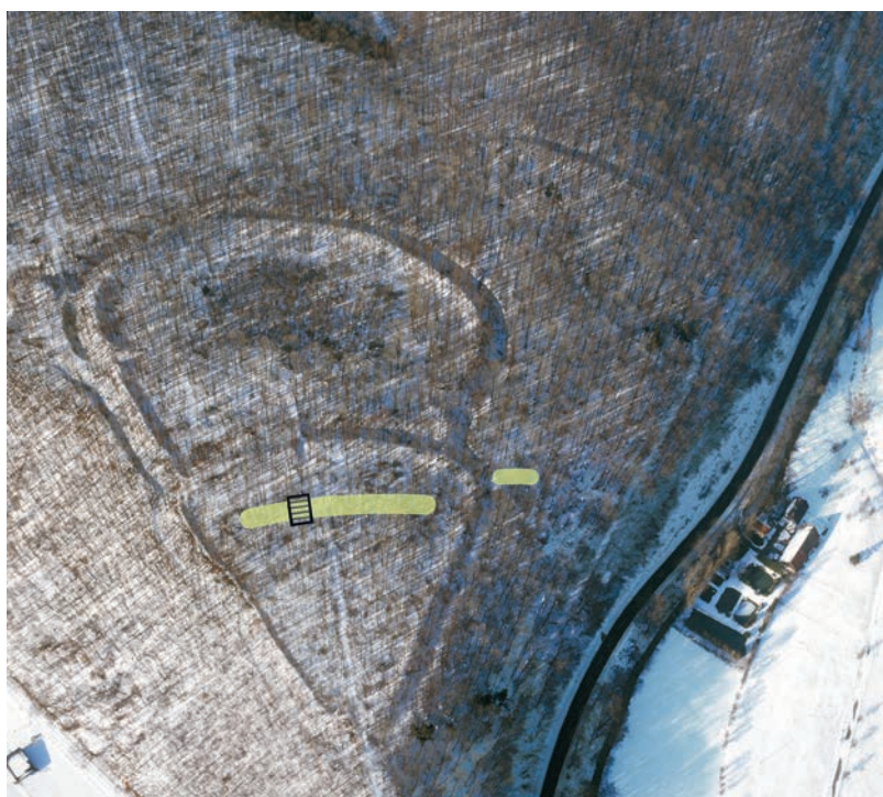
Abb. 1 Luftbild der »Hünenburg« bei Borchon-Gellinghausen mit gekennzeichneten eisenzeitlichen Wall- und Grabenresten (Schraffur: Toranlage). Die Spitze des Sporns, auf der die Anlage liegt, weist nach Osten.

Die sechs Objekte sind recht klein (Abb. 3 und 4). Das größte Exemplar ist 20,5 cm lang, das kleinste misst nur noch 14,1 cm. Die Blätter sind besonders bei den geschweiften Stücken Nr. 2, 3 und 6 recht schmal, die Blattdicke beträgt bei allen sechs Waffen lediglich