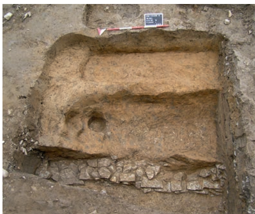
Abb. 3 Kellermauer und Grubenhaus aus der ersten Hälfte des 11. Jahrhunderts.

derungen, die sich in der Bebauungsstruktur des untersuchten Grundstückes in der zweiten Hälfte des 12. Jahrhunderts feststellen lassen (Abb. 4). Der Umformungsprozess Paderborns etwa zwischen 1150 und 1180 führte dazu, dass zwischen der Marktsiedlung und