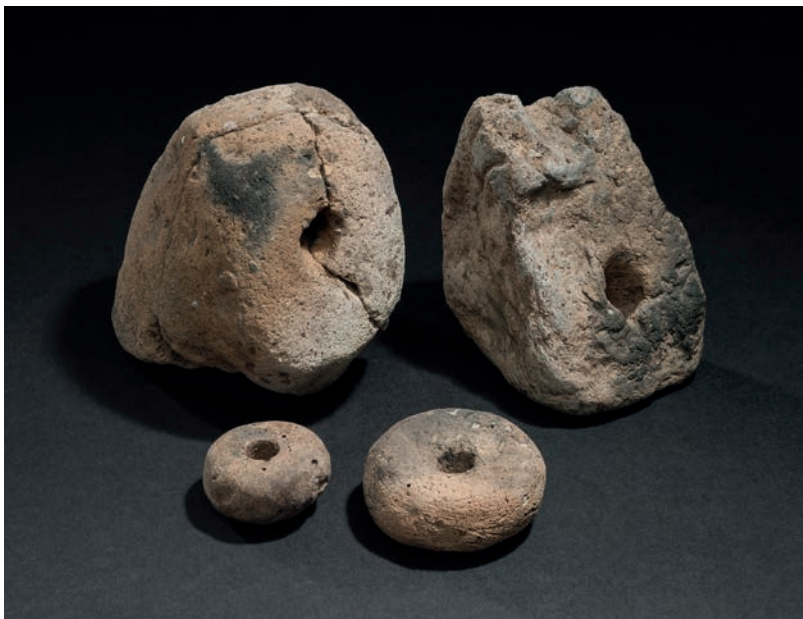
Abb. 1 Spinnwirtel und Webgewichte der vorrömischen Eisenzeit (Foto: LWL-Archäologie für Westfalen/S. Brentführer).

Über 1000 Jahre später wurde das Areal ein Teil der sich nach Süden ausdehnenden Marktsiedlung, die der Domburg mit der Kaiserpfalz und dem Bischofssitz westlich vorge-lagert war. Innerhalb des Zeitraumes vom Ende des 10. bis zur Mitte des 11. Jahr-hunderts standen auf dem Areal in der Westernstraße 15 zwei Grubenhäuser und zwei Keller mit Kalkbruchsteinmauern im Lehmverband ( Abb. 2 ). Bei den Kellern handelte es sich sehr wahrscheinlich um Speicher, bei denen die Mauern als Grundlage für eine Fachwerkkonstruktion fungierten. Reste dieser Bauart waren bei einem vergleichbaren Gebäudegrundriss an der Straße »Im Düstern« noch erhalten. Damit liegen nun drei solcher Gebäude vom späten 10. bis zur Mitte des 12. Jahrhunderts für die Paderborner Marktsiedlung vor. Aus Höxter stammen zwei gute Vergleichsbefunde derselben Zeit vom Brückenmarkt.