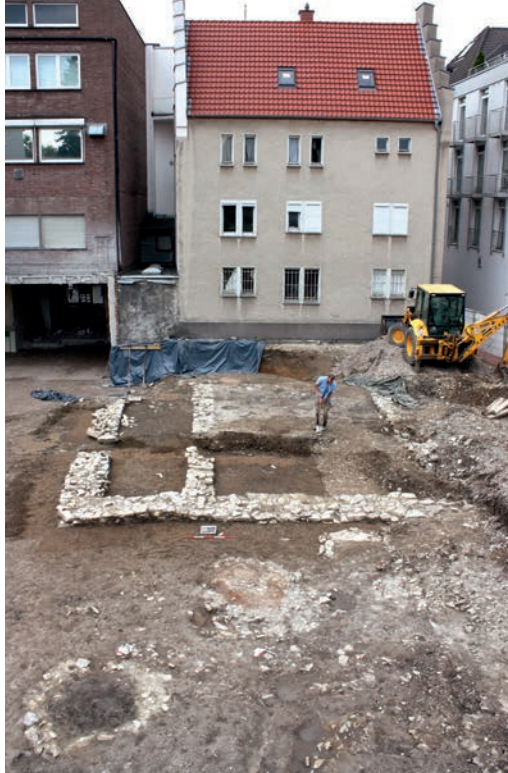
Abb. 5 Fundamente des Wohngebäudes mit mittelalterlichem Steinwerk sowie Brunnen vorn links und Ofenrest schräg rechts dahinter.

The oldest settlement pits uncovered during an excavation on Westernstraße road in Paderborn date from the pre-Roman Iron Age. From the 10 th century onwards, pit dwellings and cellars were built at the site on the southern edge of the market town, which was located to the west of the Paderborn cathedral precinct. A family of bakers took up residence in the second half of the 12 th century and remained there for approximately 200 years. They operated three ovens until the property was abandoned and the site was turned into a garden.