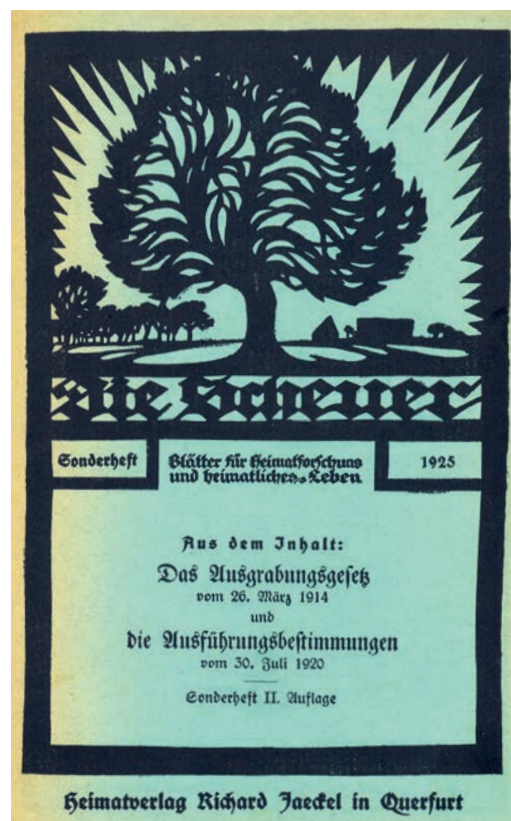
Abb. 1 Der Titel des Bandes »Die Scheuer. Blätter für Heimatforschung und heimatliches Leben im Kreise Querfurt« von 1925.