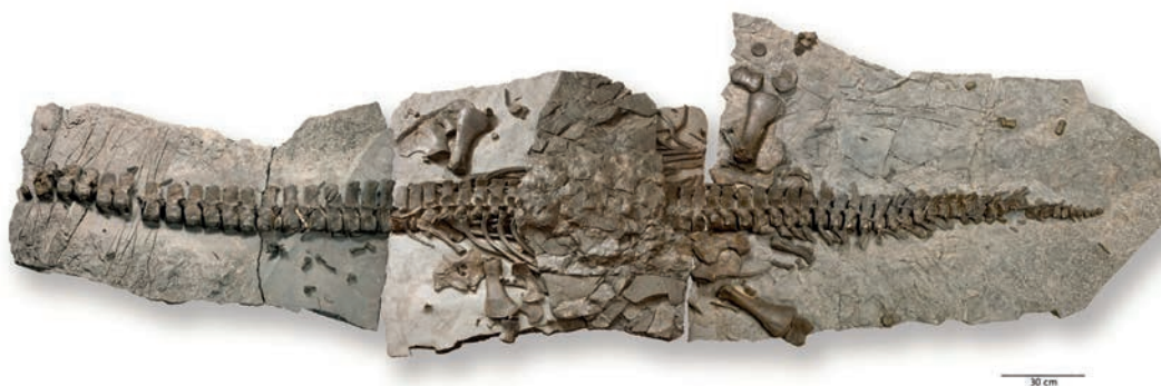
Abb. 3 Das 190 Mio. Jahre alte Fossil des »Plesiosauriers« aus Nieheim, Kr. Höxter, datiert in das Untere Jura/Lias und ist eines der wenigen beweglichen Bodendenkmäler in Westfalen-Lippe (Foto: Steinmann-Institut Universität Bonn/G. Oleschinski).

Der Gesetzgeber hat außerdem die Befugnisse der Denkmalbehörden und der Denkmalpflegeämter im Zusammenhang mit der Betretung von Grundstücken ausgeweitet. Bislang hatten Eigentümer und sonstige Nutzungsberechtigte von Denkmälern nach vorheriger Benachrichtigung zu gestatten, dass die »Beauftragten der Denkmalbehörden« Grundstücke und Wohnungen betreten sowie Prüfun-