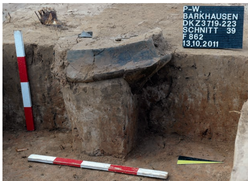
Abb. 1 Urnengrab 862 während der Ausgrabung. Die Wurzeln eines Baumes haben die Urne stark beschädigt.

Das 16,8 cm lange Tüllengriffmesser hat eine aufwärtsziehende, leicht konisch nach hinten verbreiterte Grifftülle von 6,3 cm Länge; ihr Durchmesser beträgt am inneren runden Tüllenmund 1,7 cm und ist mit drei umlaufenden Rippen verziert. Die Tülle endet ohne zu-