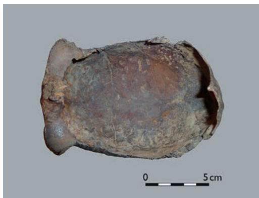
Abb. 2 Innenansicht der Schädelkalotte, wo die Schädelnähte nicht mehr zu erkennen sind (Foto: LWL-Archäologie für Westfalen/M. Baales, A. Müller).

gekommen, das 2010 in Kiel untersucht wurde und demnach – da etwas jünger ( 2107 \pm 51 cal BC; KIA 43266: 3710 \pm 30 BP) als das Werner Stück datiert – bereits an den Übergang vom Endneolithikum in die frühe Bronzezeit gehört. Deutet sich mit diesen beiden Datierungen tatsächlich bereits für das Endneolithikum die besondere Praxis an, Schädel in Gewässernähe zu deponieren, ähnlich wie für die Eisenzeit vermutet?