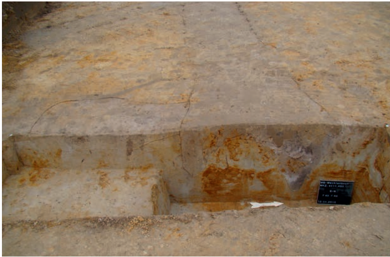
Abb. 3 Äußerer Kreisgraben im Profil.

westfälischen Endneolithikum oder der frühen Bronzezeit angelegt. Während sich andere Grabhügel noch heute deutlich im Gelände abzeichnen, war dieser wohl schon kurze Zeit nach seiner Anlage nicht mehr sichtbar, wie die räumlichen Überschneidungen zwischen den eisenzeitlichen Pfostengruben und den Kreisgräben vermuten lassen.